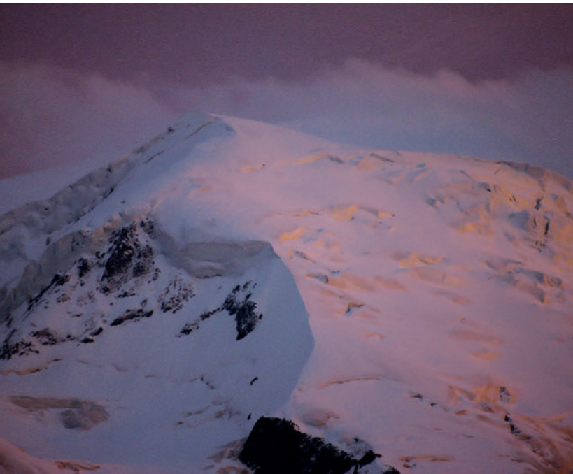
Mont Blanc mendiaren lehen igoera gizaki berri baten sorrera gisa irudikatu zen

idaztea erabaki zuen. XVII. mendean idatzi arren, zentsurak mendebete beranduago argitaratzea eragin zuen. Garaiko beste idazle neoklasikoen gustuaren arabera dirudi Larramendik mendiaz ematen duen irudia. Nafarroako Pirinioei "barrancos enormes montañas" deritze, Aloña eta Aizkorri "montañas