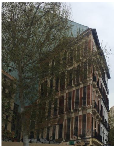
Figura 1 Trampantojo en una medianera en el barrio "la Latina" en Madrid