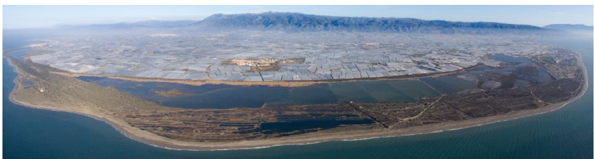
Figura 3 fotografía satélite del Campo de Dalías, en el área de influencia de El Ejido. https://jcuapa.es/wp-content/uploads/2018/06/Panoramica_portada.bmp