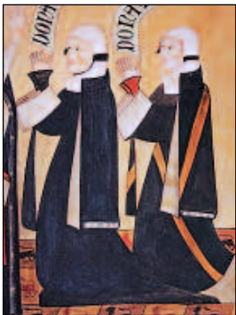
Leonor de Guzmán y María Sarmiento vestidas siguiendo la moda castellana. Detalle del retablo de Quejana.

mercantil y del transporte en Vasconia y a la posición geoestratégica, durante la Baja Edad Media, de Álava, Bizkaia y Gipuzkoa en la ruta comercial Sur-Norte, que unía Castilla con Francia, Inglaterra, Flandes y países hanseáticos a través de los puertos vascos, el abastecimiento de tejidos se alcanzaba a través importación.