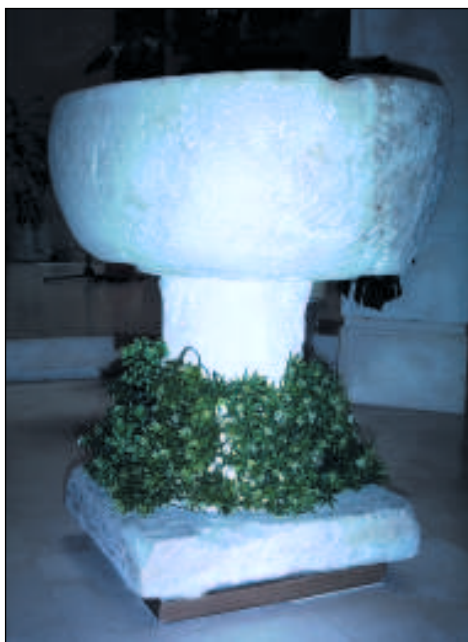
Pila bautismal del siglo XV (Villaluenga, Álava).

Si las circunstancias del embarazo eran lícitas, el parto se desarrollaban sin problemas y el recién nacido superaba el primer día de vida, el siguiente paso era bautizarlo, ahora en la iglesia y con un sacerdote, padrinos y demás familiares, para luego asistir a una colación conjunta, en la que se festejaría públicamente, ante toda la comunidad, el natalicio. De no proceder de tal forma, sobre la familia en cuestión se cerniría la sospecha de irreligiosidad. El obispado de Calahorra estipulaba en 1410 un número máximo de tres padrinos: dos padrinos y una madrina en caso de los niños y dos madrinas y un padrino en caso de las niñas. Esto significa que con relativa frecuencia el número de padrinos era superior y había que controlar tal costumbre. En ella incide la necesidad de buscar cuantos más protectores para el niño mejor; pero también demostrar la fuerza de un linaje rural en plena época de luchas de bandos o aumentar el grupo parentelar, y en consecuencia la fuerza del linaje con nuevas incorporaciones, ya que el apadrinamiento generaba un parentesco espiritual de tal fuerza, que incluso la Iglesia declaraba prohibidos los matrimonios entre padrinos y ahijadas, y viceversa, al considerarlos incestuosos. Los nombres estrellas elegidos en los siglos XIV y XV fueron, sin ningún género de duda, los de Juan para los