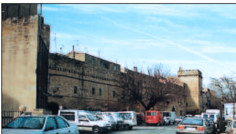
Murallas de la villa medieval de Laguardia.