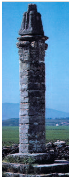
Detalle de la picota de Mendoza (Álava), símbolo de justicia señorial.