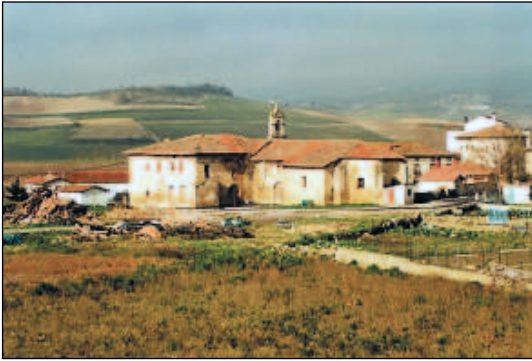
Conjunto hospital y ermita de la Puebla de Arganzón.