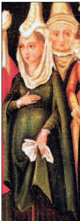
Mujer embarazada. Detalle del cuadro "Besamanos de Fernando el Católico".

sas de compartirla con otras que carecieran de ellas. La razón estriba en que durante su ausencia pudiera ocurrir que algún embarazo o parto se malograra, y era una contingencia a evitar a toda costa. En Lekeitio, a comienzos del siglo XVI, el Ayuntamiento libraba una cantidad anual de 160 mrs. para el pago de su partera y fidelizar de este modo su compromiso con la localidad. Además de estar en la nómina de los concejos cobraban por sus servicios: en Portugaleta, en 1459, la partera percibía 20 mrs. por cada alumbramiento, más su mantenimiento (comida) durante el tiempo que atendía a la parturienta. Desgraciadamente, y a pesar de los esfuerzos de estas mujeres, muchos niños fallecían al nacer, y lo hacían sin haber sido bautizados, por lo que sus almas iban al Limbo. Para evitar esta circunstancia, el obispado de Calahorra dispuso que las comadronas fueran instruidas por los sacerdotes de la diócesis para