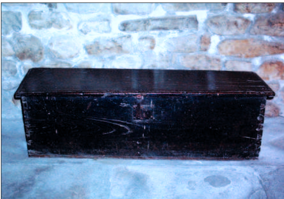
Arca. Claustro de San Miguel de Oñati.

El mobiliario de la casa urbana era sumamente sobrio, limitándose a lo meramente imprescindible. Entre ello, obviamente, destacan la mesa de la cocina y la cama. La mesa era un tablero sobre caballetes y movable, donde se desarrollaban las labores domésticas, la preparación de los alimentos y la comida. La cama en principio era compartida por padres e hijos, pero poco a poco, sobre todo a partir del siglo XV, se fueron individualizando o cuando menos una para hermanos de un mismo sexo, para evitar las torpezas de la carne, según aconsejaba el moralista de la Universidad de París, Jean Gerson. Al no existir habitaciones para todos los habitantes de la casa, una forma de separar los espacios y conseguir una mayor intimidad fue la aparición de las camas con dosel. Entre los muebles también encontramos asientos, como los bancos corridos empleados con la mesa de la cocina, algunas sillas y excepcionalmente cátedras o asientos con respaldo y apoya-