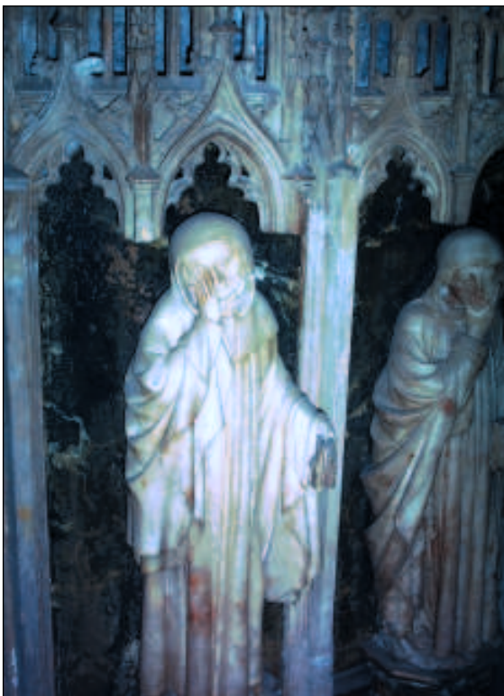
Detalle del sepulcro de Carlos III el Noble (catedral de Pamplona).

A lo largo del siglo XIV lo macabro se irá adueñando de las representaciones plásticas o literarias del memento mori , con gran éxito a nivel popular. Es una forma de transmitir a un mismo tiempo el horror de la muerte y una advertencia de lo inevitable a través de las Danzas de la muerte o de los cuerpos putrefactos ( transis o transidos ) protagonistas del tema de los Tres vivos y tres muertos . Esta nueva visión macabra de la muerte alcanzará también al territorio vasco a través de la influencia francesa, con ejemplos tan notables como la Danza de la muerte de comienzos del siglo XV de la fachada del cementerio de los Inocentes de París ordenada por el duque Jean de Berry. En efecto, durante la dinastía de Evreux la introducción de la plástica gótica y de artistas franceses se intensifica, alcanzando su cenit durante el reinado de Carlos III el Noble. Las Danzas suponen un mensaje igualitario ante la muerte, para la que no cuentan distinciones sociales ni materiales de ningún tipo. La muerte alcanza a todos por igual. El propio monarca Carlos III en su testamento reflexiona sobre esta cuestión, indicando que “ la hora incierta de la muert que uex segund la ordenança e caso de natura et por tal tiempo como