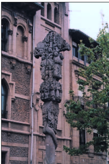
Cruz de Kurutzia (Durango).