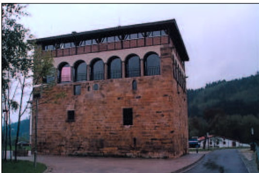
Torre de Muncharaz (Abadiño).