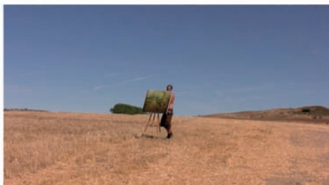
Fig. 2 AUDIO: – “Ese árbol está demasiado centrado. Hay que sacarlo del encuadre.” – “¿Tú crees?” – “¿No lo ves?”