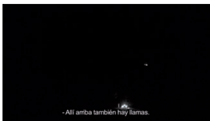
Fig. 3 SUBTÍTULO: – “Allí arriba también hay llamas.”

Y el reto se asumió desde la primera versión del montaje. En ella se desechó el recurso de las voces de los cineastas y se optó por insertar subtítulos. Es decir, sobre la imagen aparecen textos correspondientes a diálogos que nunca se oyen en la banda de audio. En un principio, estos textos correspondían bien a conversaciones reales registradas en el material bruto aunque desplazadas de su imagen original, bien a conversaciones que tuvieron lugar durante el rodaje pero que ni siquiera habían sido grabadas, en otras palabras, el recuerdo de diálogos reales. Trasladar estos textos, fugaces e inconexos, al formato escrito, provocaba un cambio en su propia sustancia. Desprovistos de entonaciones, timbres de voz o rostros a los que incorporarlos, estos textos flotantes pasaban a tener un carácter casi neutro, extremadamente maleable. Una maleabilidad multiplicada con el pronto descubrimiento de que esos diálogos transcritos podían ser complementados, matizados y transformados por otros textos absolutamente inventados por nosotros en la sala de montaje, es decir, por la introducción en la ecuación de los procedimientos del guión de ficción e, incluso, del género.