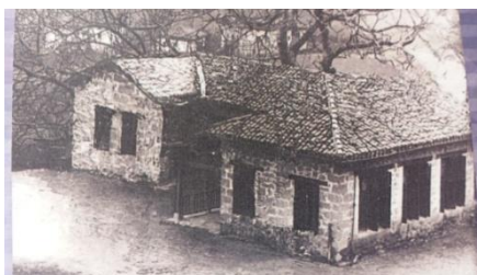
2. irudia: Santa Lucia eraikita