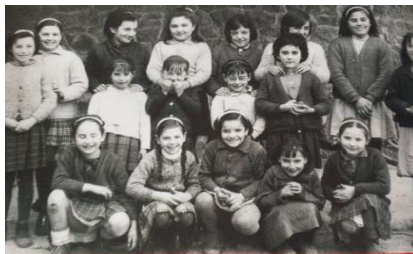
6. irudia: nesken taldea

Garai honetan ere aurreko garaietako gauza asko mantentzen ziren: adin tarte berdinetan ikasten zen, gaztelaniaz eta neskak eta mutilak banatuta jarraitzen zuten, adin desberdinetakoak biltzen zirelarik geletan; sarreretan “Cara al Sol” abesten jarraitzen zen; materiala eta ikasgaiak ere berdinak izaten jarraitzen zuten, neskatok josten eta janaria prestatzen ere ikasten zutelarik.