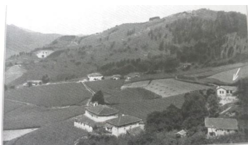
1. irudia: Santa Lucia-ren kokapena