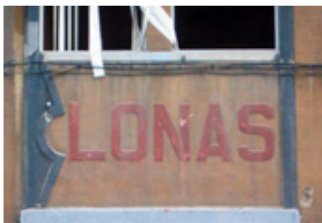
612. Ribera de Deusto.