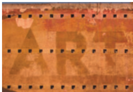
603. Fachada sur-este desde el Ramal de Olabeaga.