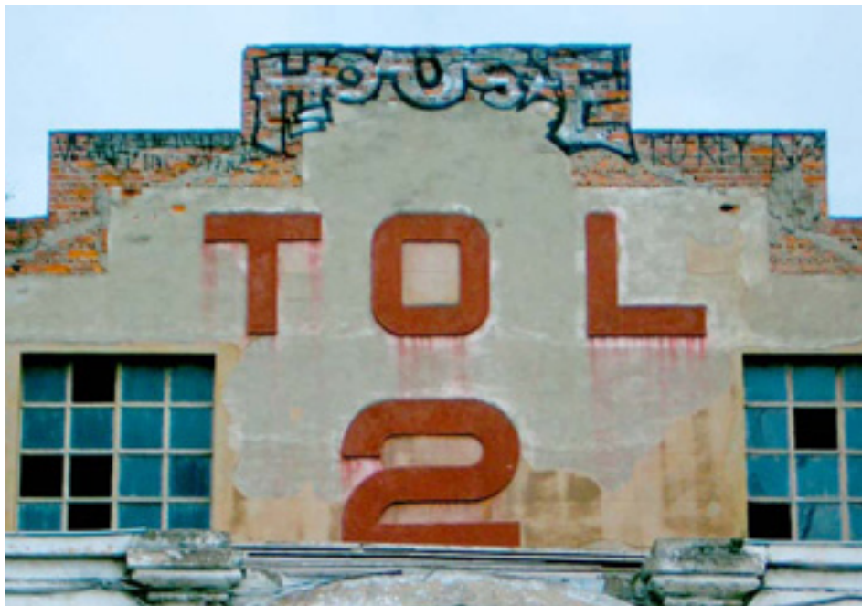
607. Ribera de Deusto

Los rótulos del pequeño negocio en el paisaje de Bilbao