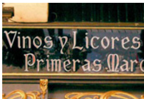
630. Plaza Nueva.