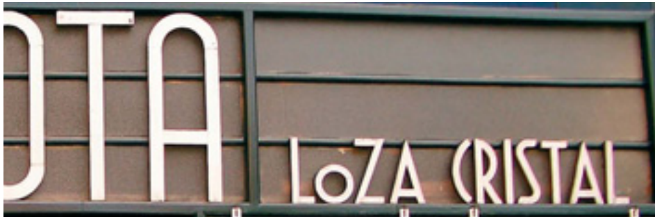
647. Colón de Larreátegui.

Los rótulos del pequeño negocio en el paisaje de Bilbao