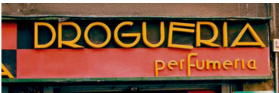
640. Colón de Larreátegui.