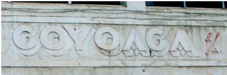
609. Ribera de Deusto.

Los rótulos del pequeño negocio en el paisaje de Bilbao