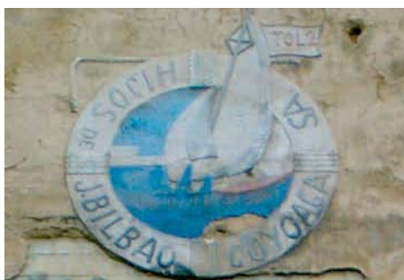
610. Ribera de Deusto.

El conjunto arquitectónico de la fábrica era empleado como una gran valla publicitaria. Todos y cada uno de los lienzos de fachada portaban su correspondiente rótulo, anunciando tanto la marca como la línea de productos.