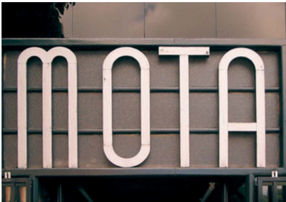
646. Colón de Larreátegui.