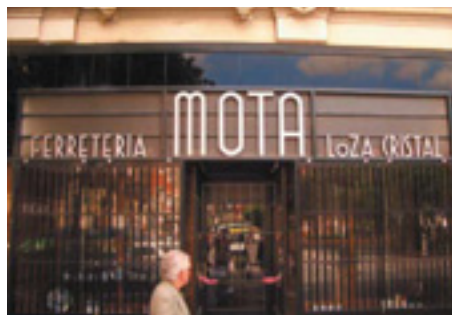
645. Colón de Larreátegui.

El rótulo de La Bolsa no sólo muestra una enérgica tipografía sino que combina materiales de alta calidad. Los geométricos caracteres son de bronce en ligero relieve sobre mármol enmarcado en basalto.