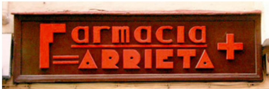
641. Licenciado Poza.

Los rótulos del pequeño negocio en el paisaje de Bilbao