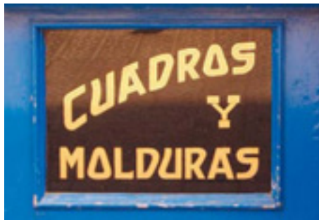
624. Alameda de Mazarredo.