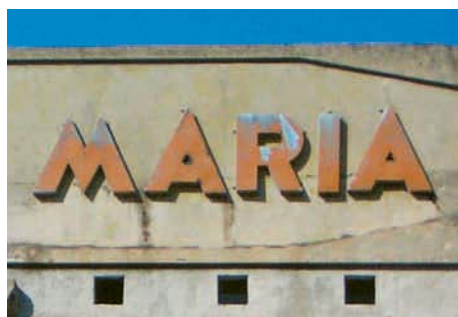
602. Ribera de Deusto.

Los rótulos del pequeño negocio en el paisaje de Bilbao