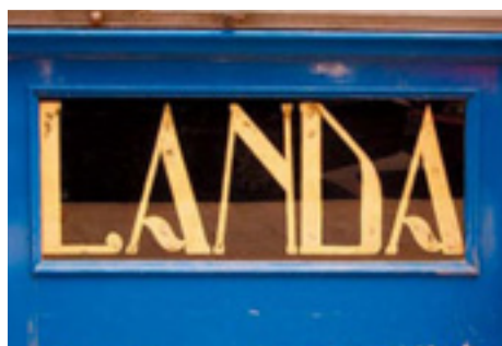
625. Alameda de Mazarredo.

Lo más llamativo en los múltiples rótulos de la cristalería Landa es la variedad de estilos. Esto se debe a la voluntad anticlasicista que profesaba el Modernismo de finales del siglo XIX. Esta actitud impulsaba a transgredir los cánones tipográficos, introduciendo un alto grado de subjetividad en los diseños. Además, los propios rótulos de la cristalería podrían hacer las veces de muestrario para los posibles clientes.