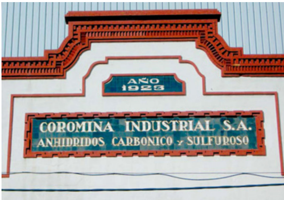
606. Ribera de Deusto.

La diferencia de estilo entre estas dos fachadas es enorme. Estéticamente se hallan separadas por todo un siglo, aunque hayan sido construidas con tan solo una década de diferencia. La fachada de Artiach, de 1937, muestra una marcada influencia del Movimiento Moderno eliminando cualquier rastro decorativo tanto de los elementos arquitectónicos como de la tipografía.