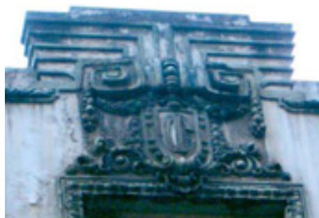
600. General Concha.