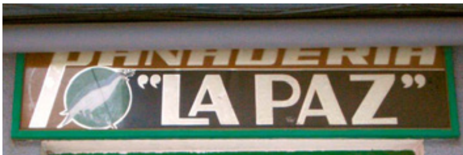
648. Almirantes Oquendo.

El rótulo de la ferretería Mota saca un gran partido a materiales muy comunes. La relación entre intención estética, simplicidad formal y economía de costes es muy positiva.