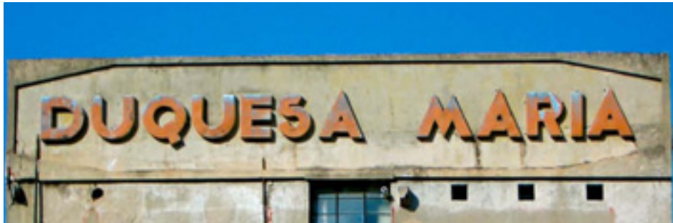
605. Ribera de Deusto.