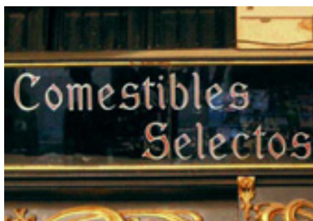
631. Plaza Nueva.