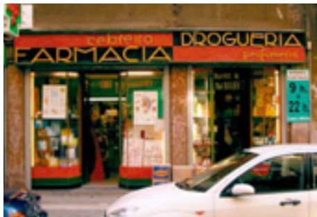
637. Colón de Larreátegui.

Los rótulos del pequeño negocio en el paisaje de Bilbao