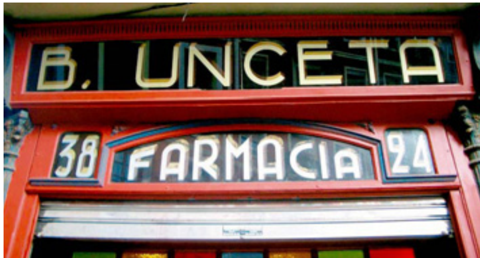
633. San Francisco / Bailén.

Los rótulos del pequeño negocio en el paisaje de Bilbao