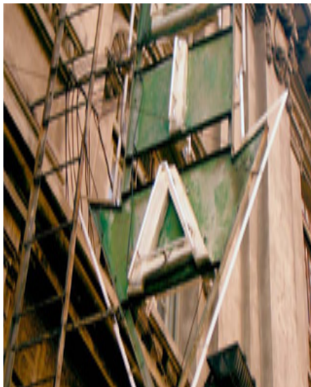
619. Alameda de Urquijo.

El rótulo de las Bodegas Bilbaínas, hecho en cerámica vidriada, se halla perfectamente integrado en la arquitectura. Su decidido carácter geométrico combina perfectamente con el planteamiento racionalista del edificio.