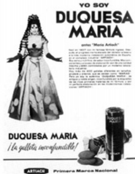
604. Anuncio de prensa. 1959.

Tanto en los rótulos como en el anuncio impreso se mantiene la rotunda tipografía geométrica.