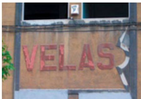
613. Ribera de Deusto.