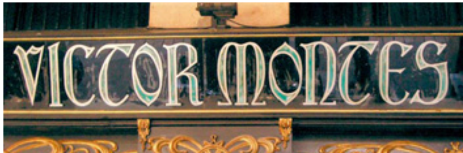
629. Plaza Nueva.