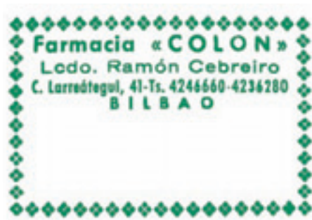
638. Estampa de la farmacia.