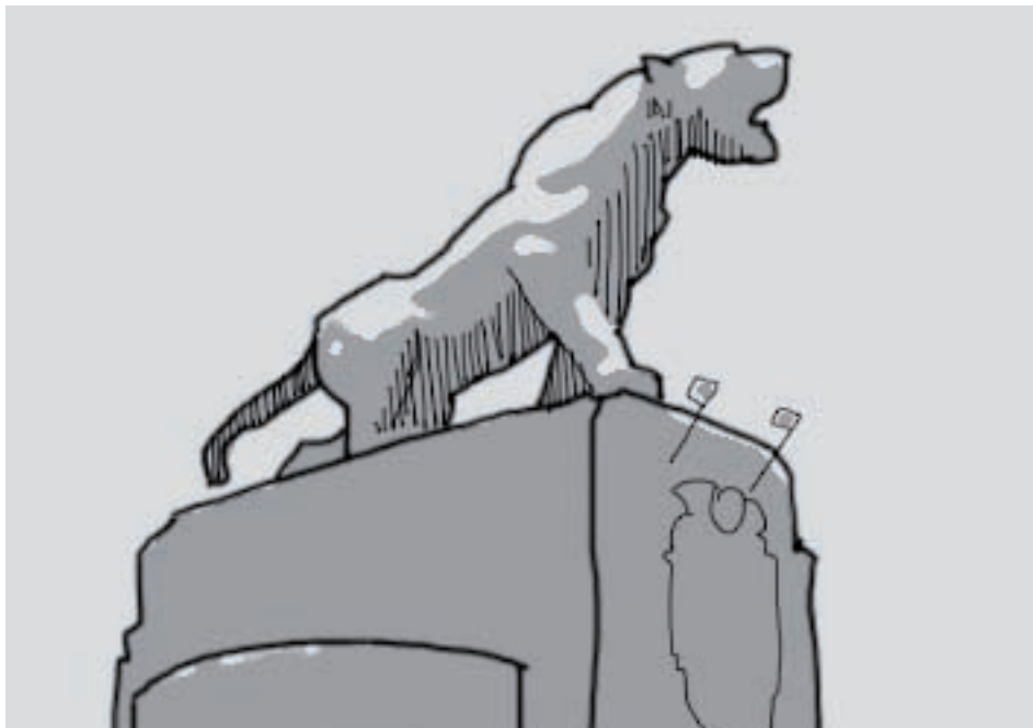
614. Ribera de Botica Vieja.