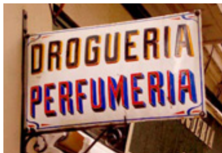
652. Ibáñez de Bilbao.

Pese a la rústica reparación del desconchado, el rótulo sigue conservando gran belleza.