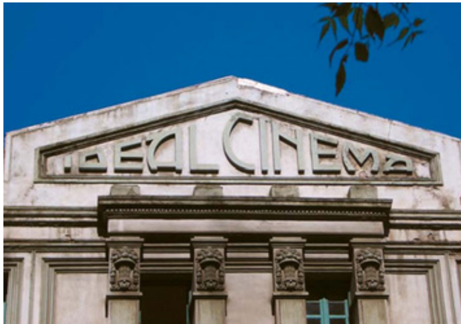
599. General Concha.

Los rótulos del pequeño negocio en el paisaje de Bilbao