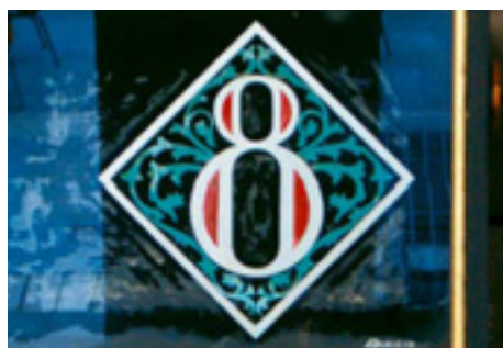
632. Plaza Nueva.

El Modernismo tenía una poderosa vertiente medievalista, estética nostálgica heredada del Romanticismo y compartida por el movimiento Artes y Oficios inglés.