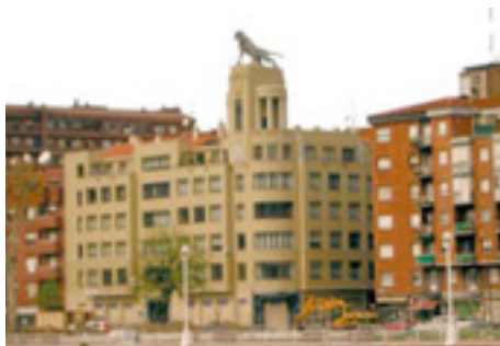
615. Vista desde Abandoibarra.