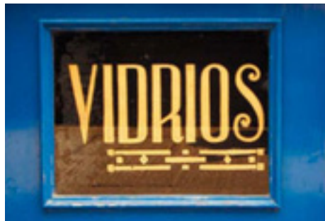
623. Alameda de Mazarredo.

Los rótulos del pequeño negocio en el paisaje de Bilbao