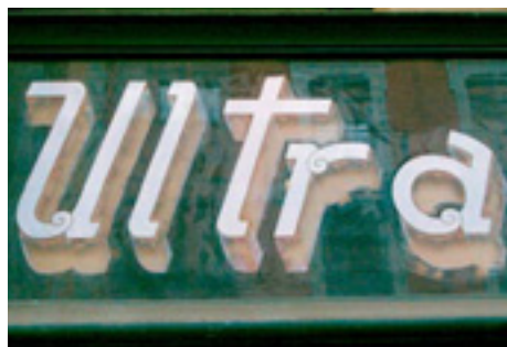
626. Fernández del Campo.

Lo más llamativo en los múltiples rótulos de la cristalería Landa es la variedad de estilos. Esto se debe a la voluntad anticlasicista que profesaba el Modernismo de finales del siglo XIX. Esta actitud impulsaba a transgredir los cánones tipográficos, introduciendo un alto grado de subjetividad en los diseños. Además, los propios rótulos de la cristalería podrían hacer las veces de muestrario para los posibles clientes.