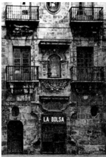
643. Santa María.

La ferretería La Bolsa dio nombre al Palacio Yohn, en donde ubicaron su primera sede. A finales de los años 1920 estrenaron otro local en la calle Astarloa profusamente decorado según el estilo Art Decó.