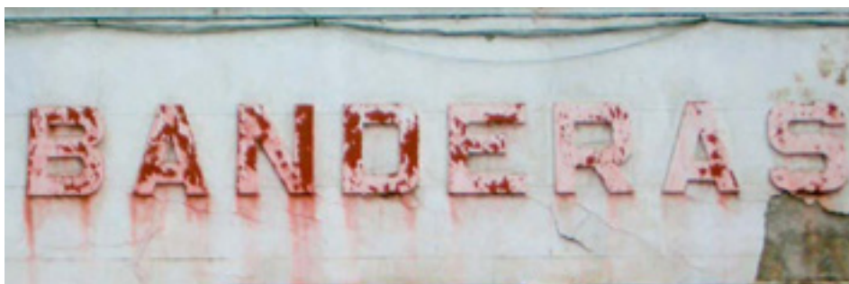
611. Ribera de Deusto.

Su privilegiada ubicación a orillas de la ría suponía una inmejorable oportunidad para darse a conocer al tráfico marítimo que atracaba en los muelles de Bilbao.