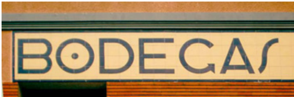
617. Particular del Norte.

Los rótulos del pequeño negocio en el paisaje de Bilbao