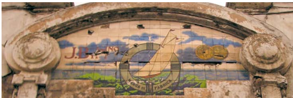
608. Ribera de Deusto.

Las fachadas de la factoría de lonas y aprestos Bilbao Goyoaga, en la Ribera de Deusto, muestra rótulos de diferentes estilos ya que se fueron construyendo en épocas sucesivas. La leyenda que presidía la nave principal (fig. 607) demuestra una actitud abiertamente publicitaria, empleando fórmulas lingüísticas muy audaces para su tiempo. El rótulo de la parte inferior fue rescatado por técnicos de Patrimonio de la Diputación de Bizkaia ante el inminente derribo del edificio. Se contempla su reubicación, como pieza monumental, una vez sea reurbanizada la península de Zorrozaurre.