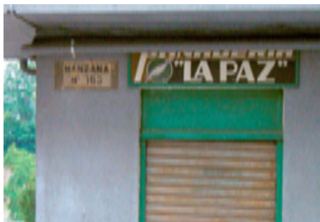
649. Almirantes Oquendo.

El último representante de lo que fue una cadena local de panaderías se encuentra semi oculto por una tubería. No se otorga valor a los rótulos, una vez finalizado su cometido anunciador.