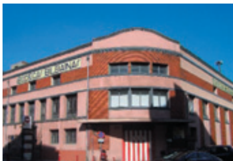
618. Bailén / Particular del Norte.

El rótulo de las Bodegas Bilbaínas, hecho en cerámica vidriada, se halla perfectamente integrado en la arquitectura. Su decidido carácter geométrico combina perfectamente con el planteamiento racionalista del edificio.