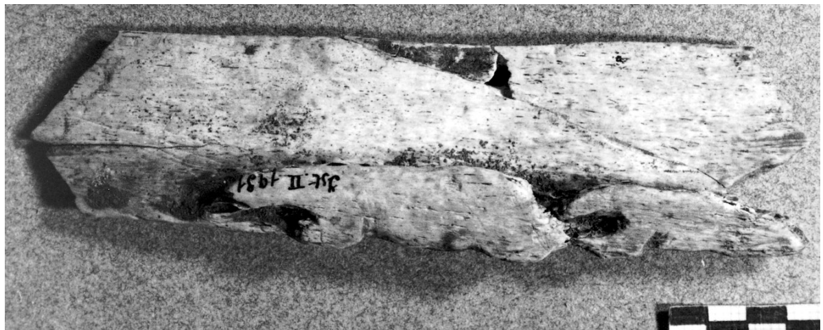
FIG. 1 Y FOT. 1. Pareja de osos sobre costilla procedente del nivel magdalenense de Isturitz