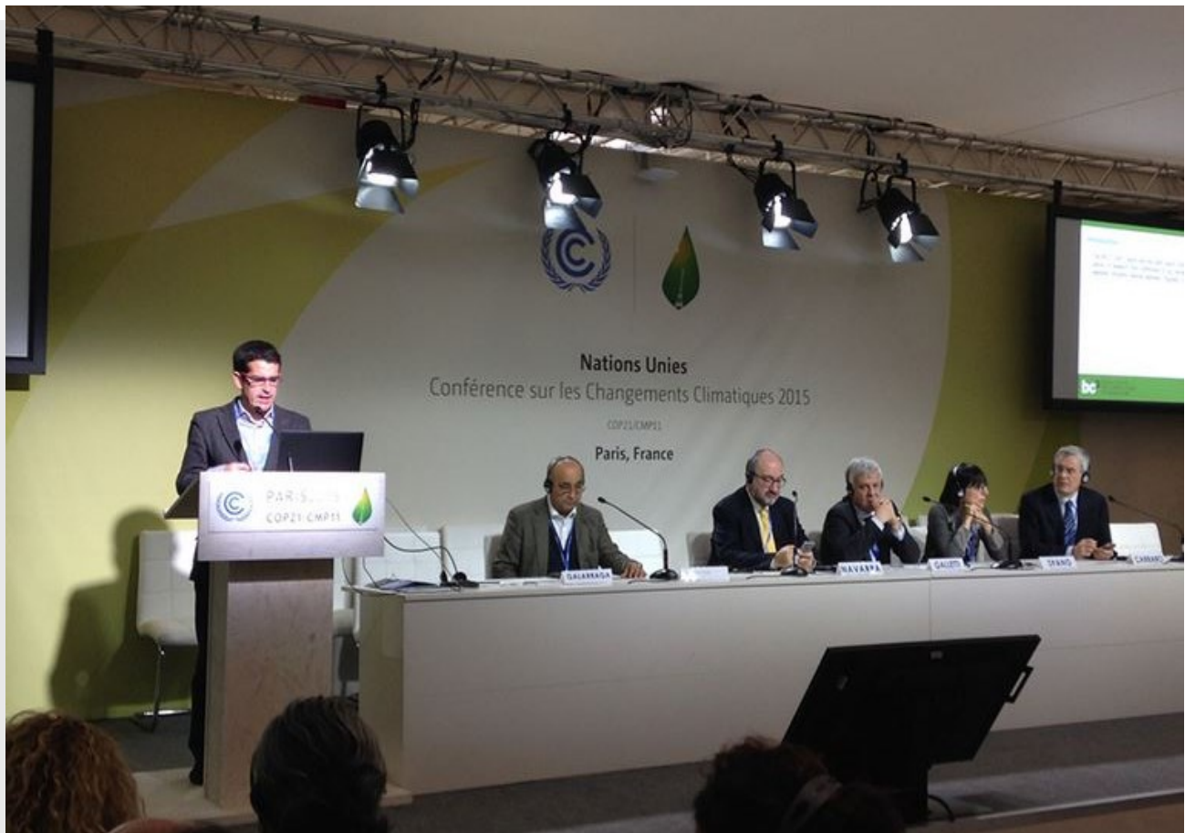
Acto paralelo organizado por BC3 en la COP21-CMP11 (París 2015) "Regions and Climate Change: A major challenge for local communities" (Regiones y cambio climático: Un gran reto para las comunidades locales), 10 de diciembre de 2015 (CMNUCC)

Por lo que respecta a la gobernanza, el acuerdo prevé el requisito especial de integrar políticas climáticas a todos los niveles , tanto en el caso de los mercados de emisiones como de otras políticas climáticas nacionales, regionales y locales. Este es un reconocimiento explícito de la labor realizada por otros actores como los gobiernos, empresas y otros agentes regionales y locales. Otro logro del Acuerdo es que cierra el círculo de la lucha contra las causas y las consecuencias del cambio climático incluyendo objetivos y medios de ejecución para la adaptación (a los ya inevitables efectos del cambio climático) y para las pérdidas y daños (que la adaptación no podrá evitar). Con relación a esto último, el Acuerdo opta por apoyar a los países más vulnerables mediante mecanismos de colaboración (técnica y financiera) internacionales, y no exige el método de compensación , uno de los escollos que estaban obstaculizando las negociaciones.