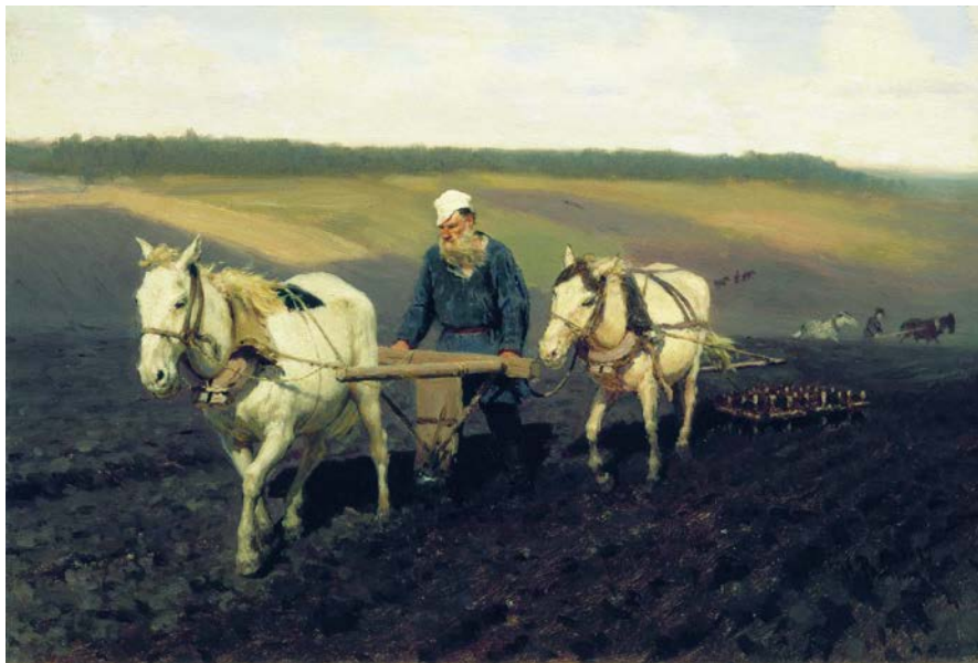
8. Irudia. Lev Tolstoi goldatzen (1887)

Margolariak garaiko errusiar izpirituaren adierazle bezala ikusten zuen Tolstoi, honen botere izpiritual berezi hori ondo harrapatu zuelarik beren errepresentazioetan 58 . Kutsu jainkotiarreko pertsonaia bat, baina horren gainetik pertsona arrunt bezala irudikatzea interesatzen zitzaion margolariari. Idazlearen herriarenganako eta bereziki nekazarienganako hurbiltasun hori ikusgarri egin nahi izan zuen Repinek. Letren gizona goldatzen, belarra mozten eta antzeko landa lanetan irudikatu zuen pintoreak. Idazlearen alde filosofikoa ere margotu zuen Repinek.