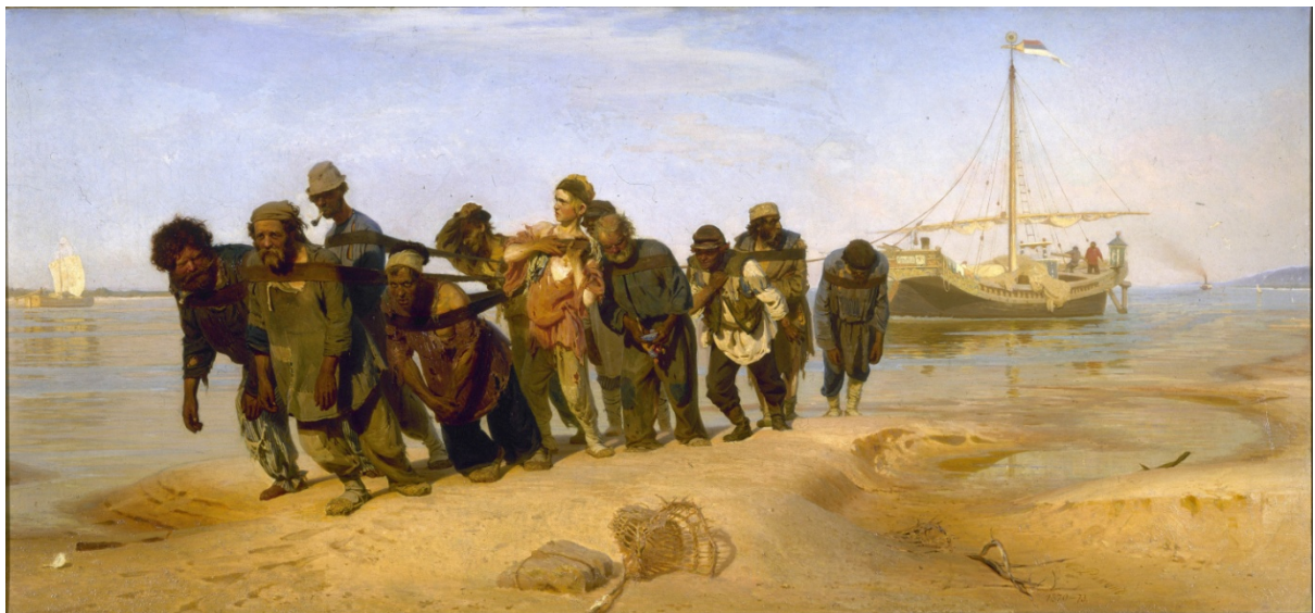
2. Irudia. Volgako ontzi garraiolariak (1870-73)

Dudarik gabe, errealismo errusiarraren helburu nagusienetakoa subjektu moderno, garaikide eta nazionala lantzea izan zen. Esan bezala, nekazari eta langileek biztanleriaren gehiengo zabalena osatzen zuten, beraz orain beraiek izango ziren protagonistak. Hau kontuan izanik, Repinek konpromiso handiz landu zituen nekazariak eta langileak. Ilyari Volgako ontzi garraiolariak (1870-73) (2.irudia) lanak emango zion benetako ospe nazional eta baita internazionala ere. Obra hau errusiar pintura errealistaren ikur nagusienetako bat bilakatu zen, momentu hartatik aurrera “ Margolaritzaren Tolstoi ” deitua izan zelarik 29 . Artista akademiatik irtendakoa eginiko lehenengo margolana dugu pintura monumental hau, Kramskoi-ek garaiko errusiar artearen jomugatzat joko zuen eta Fiodor Dostoyevsky idazleak edota Vladimir Stasov arte kritikariak ere aho batez goraiatu zuten 30 . Gaiaren krudeltasuna agerian geratzen den arren, aldi berean pertsonaien benetakotasuna nabarmentzen da, esperantza ez baitute galdu. Injustizia autokratikoaren gaineko salaketa eta nekazari indigenen adoreari egindako kantu bat dugu pintura hau. Edukia politikoa baino, etikoa dela azpimarratu behar dugu. Tolstoiren pentsamenduarekin bat datorren obra dugu, non orden sozial desberdinen arteko tentsioak agerian geratzen diren. Idazlearen nekazarien aldeko borroka ezaguna da, Gure garaiko esklabutza (1900) edota Langileriari (1902) izeneko obrak dira honen erakusle adibidez 31 .