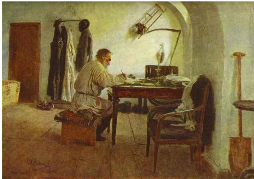
3. Irudia. Lev Tolstoi bere estudioan(1891)