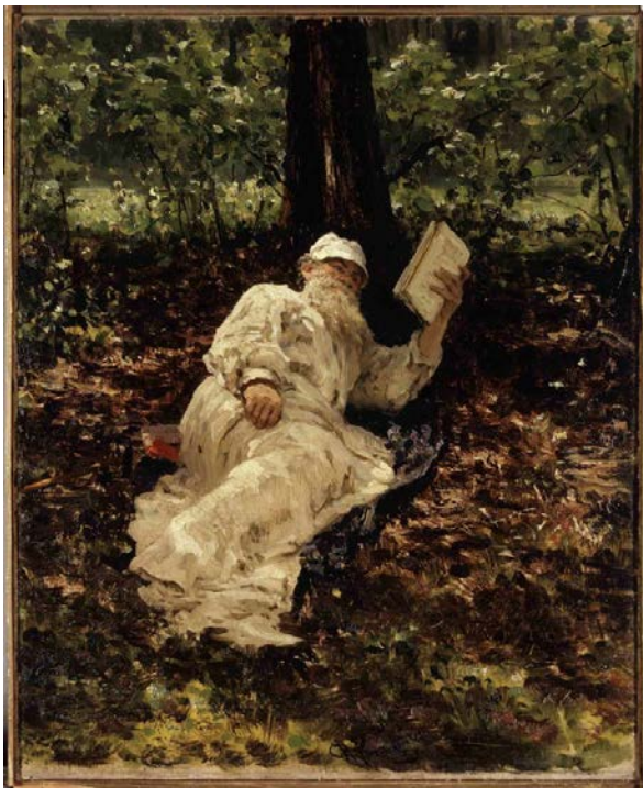
9.Irudia. Tolstoi Basoan (1891)

Oso berezia da Lev Tolstoi goldatzen (1887) (8.irudia) margolana. Eguzki kiskalgarri baten pean aristokrata nekazariz jantzita goldatzen azaltzen da. Repinek muskuluz beteriko gorputz handi eta indartsua erakusten digu. Paradoxa berezia azaleratzen zaigu erretratatuaren eta artistaren artean, biek jaiotzez tokatu zitzairen bizitzatik ihes egin nahi baitzuten 59 . Aristokrata lurra lantzen azaltzen zaigun bitartean, nekazaria ospe handidun margolari kosmopolita bilakatu zen. Tolstoi basoan (1891) (9.irudia) lana idazlearen bizitza ez ortodoxoaren isla dugu. Honetan, baso bateko zuhaizpean, zuriz jantzita, lurrean etzanda irakurtzen agertzen zaigu Tolstoi. Erakargarritasun estetikorik gabea dugu, argi-ilunekin jolasten du artistak, inpresionismoa hurbiltzen da, non idazleak eta naturak bat egiten duten.