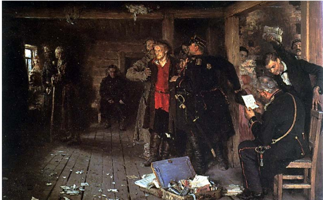
1.Irudia. Propagandista baten atxiloketa (1892)

atxiloketa (1892) (1.irudia) izeneko obrak adibidez, talde ibiltariaren estiloaren erakusle argiak dira 10 . Lev Tolstoiren hitzetan, arte ona derrigorrez zintzoa, altruista eta unibertsalki eskuragarria izan behar zen; Erakusketa Ibiltarien Taldearen ideiekin bat zetorren beraz. Repinek ondorengo aldarrikatuko zuen: “ Edertasuna egian aurkitzen da ”.