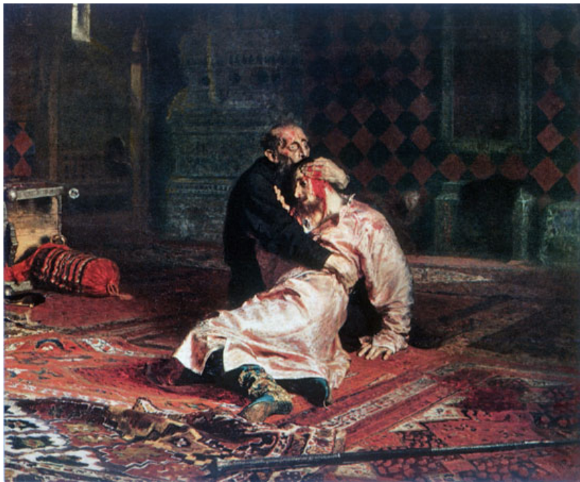
7. Irudia. Ivan Harrigarria eta bere semea (1884-85)

1881ko martxoaren 1ean Narodnaya Volia 50 talde iraultzaileak Alexander II Tsarra erail zuen. Honen ondorioz, hiltzaileak eta taldeko partaide batzuk exekutatuak izan ziren publikoki. Gertakizun hauetatik abiatuak, Repinek bere hurrengo obra egiteko ideia hartu zuen. Pasarte garaikide honek 1580.urtean gertaturiko beste bat ekarri zion gogora artistari, Ivan IV Tsarrak haserrealdi batean bere semea kolpatu eta hil zueneko hain zuzen ere. Honela, gai historiko batean oinarrituta, Ivan Harrigarria eta bere semea (1884-1885) (7.irudia) izeneko obra egin zuen margolariak. Repinek honela deskribatu zuen heriotzez beteriko gertakizun hauen ondorioz sentitu zuena: “ Nire sentsibilitatea momentuko laztura guztiez beteta dago ” 51 .