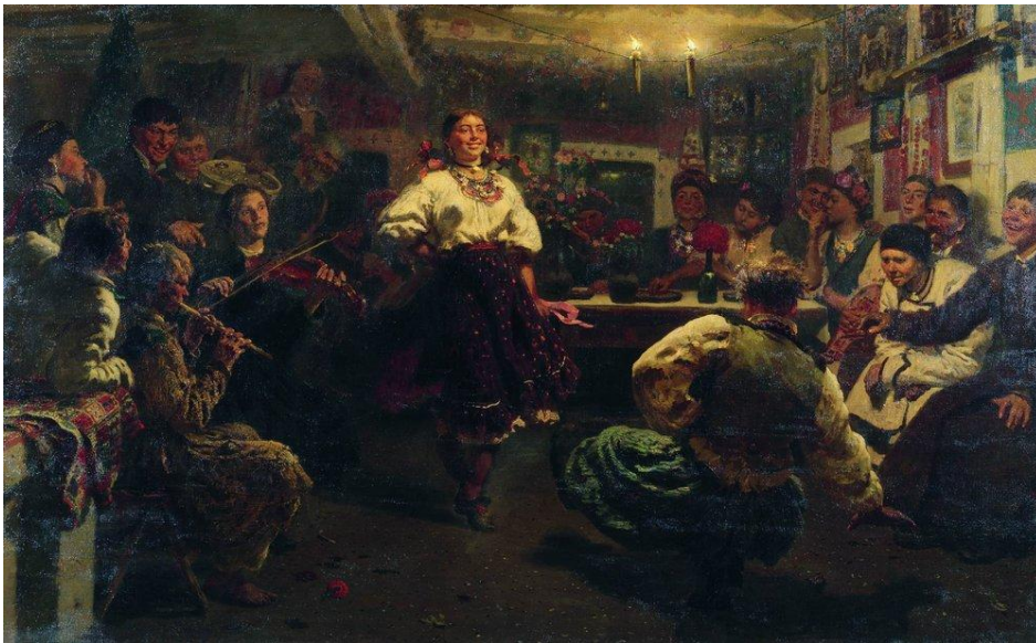
4. Irudia. Iluntzeko jaia (1881)

Iluntzeko jaia (1881) (4.irudia) deituriko Repinen margolan batean Ukrainiako jai tipiko bat irudikatzen da landa giroan. Obra hau izugarri gustatu zitzaion Tolstoiri nekazarien bizitza modu argitsu eta positiboan lantzea posible zela erakutsi baitzuen pintoreak 38 .