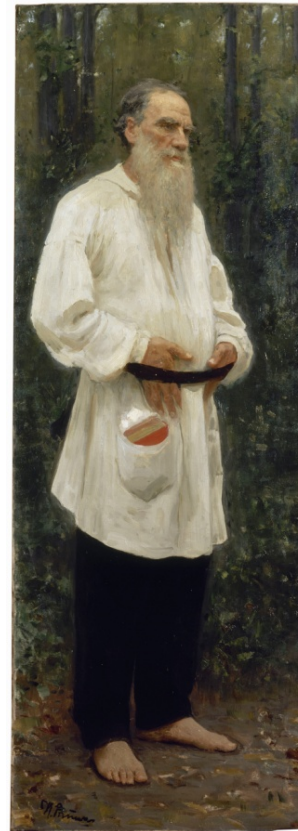
10 .Irudia. Lev Tolstoi oinutsik edo otoitzean (1901)