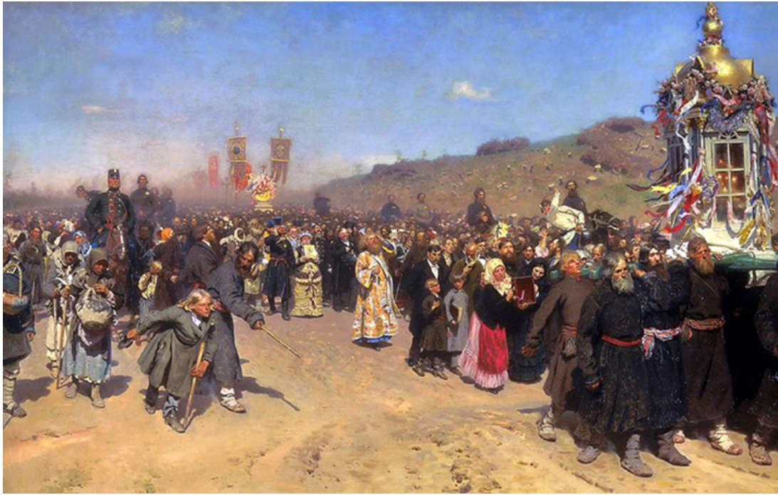
6. Irudia. Kursk-eko probintziako prozesio erlijiosoa (1883)

Ohikoa zen nekazari jai herrikoiak irudikatzea, baina Repinek alde folklorikoa alde batera utzi eta espektakulo eta batasun erlijiosoaren orde, bere garaiko gizarteko desberdintasun sozialak irudikatu zituen. Dakigunez, Tolstoiren bizitzako krisialdi existentziala zela eta, idazlearentzat Eliza Ortodoxoa herriarengandik urrun zegoen, boteretsuen ondoan jarriz eta dogmaren alde eginez. Ondorioz, errusiar eliza Jesusen ebanjeliotik erabat urrundu zela pentsatzen zuen idazleak. Literatoaren hitzetan: “Argitasunez ikusteko beharrezkoa da sineskeria kentzea” 45 . Tolstoirentzat egiaren bilaketa izan behar zen helbururik nagusia. Hau zela eta, Repinekin hitz egin zuen obraren gainean eta transmititu nahi zuenaren inguruko hausnarketa egitera gonbidatu zuen idazleak. Tolstoiren hitzetan “Herri xumearen fedea, benetako ezagutza bat da, bakean bizitzen laguntzen diena hain zuzen ere” 46 . Nekazari eta herritarren fedea, Jesusen ebanjelioarekin, honen irakatsiekin lotu zuen estuki eta Eliza Ortodoxoak honekin zerikusi gutxi zuela jabetuko zen. Honela, badirudi idazlearen hitzek artistarengan benetako eragina izan zutela, margolanaren azken bertsioa guztiz esanguratsua izan baitzen, aldi berean ospe izugarria eta kritika latzak jasoz. Repinen obra Errusiako kasta sistemaren aurkako eraso zuzena izan zen, gizartearen sufrimendua eta herritarrek bizi zuten egoera tamalgarria begi bistan utzi zituelarik. Margolana