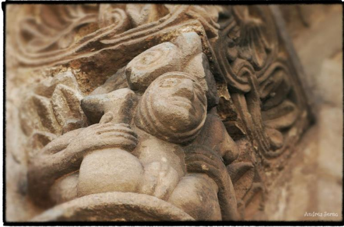
8. Irudia Cervatoseko San Petri elizako kapitel baten detailea. (Kantabria). XII.mendea.

Eskultore erromaniko kristauek, oso modu errazean lortu zuten orain arteko emakume lizuna, islamaren jarraitzaile bezala irudikatzea. Horretarako janzkerara jo zuten. Kontutan eduki behar da, lizunkeriarekin lotzen diren irudikapen gehienak biluztasunarekin lotzen direla, aurretik ikonografiak aztertzerakoan ikusi dugun