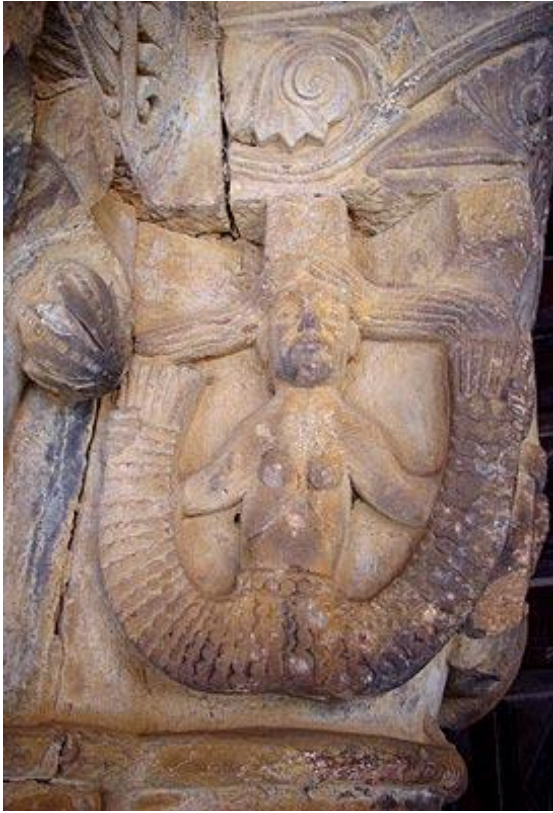
7. Irudia. San Esteban protomartiriaren elizako kapitela. (Burgos) XIII.mendea.

Lizunkeriaren bizioa irudikatzeko, beste kasu batzuetan animali fantastikoen agerpena ematen da, antzinarotik bizio honetara lotuak izan direnak. Hauen artean, dudarik gabe erabiliena sirenaren irudia izango da 39 .