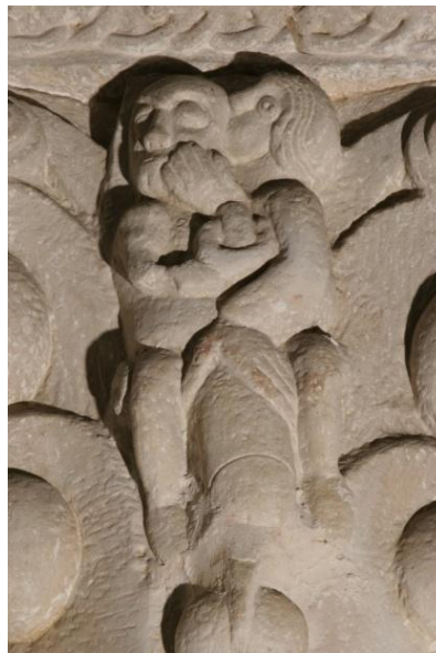
1. Irudia. Santa Juliana kolegiata. Santillana del Mar. (Kantabria) XII.mendea.