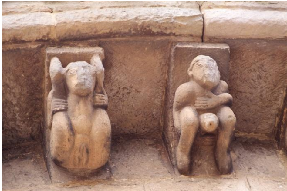
5. Irudia. Cervatoseko San Petriko harburuak. (Kantabria) XII.mendea.

Ez hain ondo kontserbatuak baina ikonografia zabalduagoarekin dauzkagu Cervatoseko San Petri elizako beste harburu batzuk (5.irudia). Oraingoan bai, bikote lizuna biluzik agertzen zaigu eta emakumeak buruaren aldeetan kokatzen ditu hankak. Eskulturak nahiko galduak dauden arren ondo identifikatzen da genitalen presentziaren protagonismoa. Harburu hauek lizunkeriaren kontrako beste irudikapen batzuek inguratuta agertzen dira.