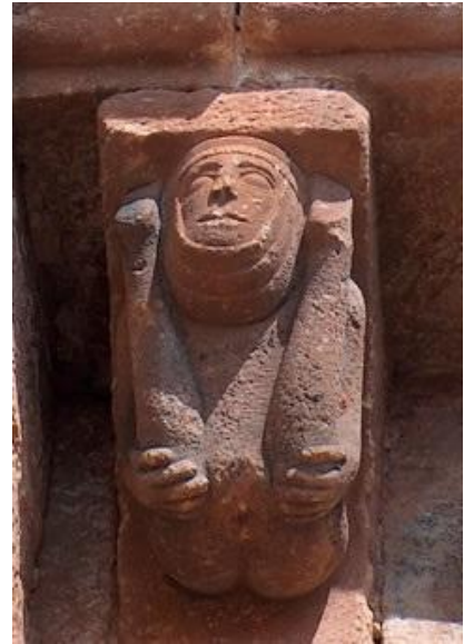
9. Irudia. Igokundearen Eliza. Jaramillo de la Fuente. (Burgos) XII.mendea.

Nahiz eta eskulturaren arlotik at egon, aipagarria da, Mahomaren ezagutzen dugun irudikapen kristau zaharrenaren berezitasuna. Irudi hau, Arsenaleko Eskuizkribuan agertzen zaigu, XII.mende erdialdean idatzitakoa. Mahoma irudikatzeke, giza aurpegia eta arrain isatsaren konbinaketa erabili zen, sirenarekin