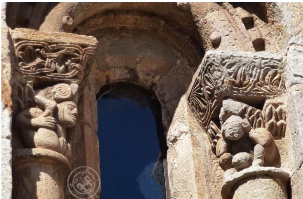
6. Irudia. Cervatoseko San Petriko bao baten kapitela. (Kantabria) XII.mendea.

Ikonografia honetan ezin dugu esan emakumeak daramala bekatuaren pisu guztia gizonezkoen eta emakumezkoen irudikapen hauek binaka agertu ohi direlako, bai bata bestearen alboko harburuetan, baita bao berdineko kapitela desberdinetan, Cervatoseko San Petri elizan bi kokapen hauetan aurkitzen dugu ikonografia hau (5. eta 6. irudiak). Biluzia beti dago presente, nahiz eta emakumezkoen kasuan, adibide askotan burua estalita agertu. Estaldura honi buruz, adituek ez dira ados jartzen: batzuek emakume ezkonduen sinbolo den mantua dela defendatuko dute, baina beste batzuen ustetan (batez ere Iberiar Penintsulako adibideetan) emakumea musulmana dela adierazteko baliabidea dela aldarrikatuko dute.