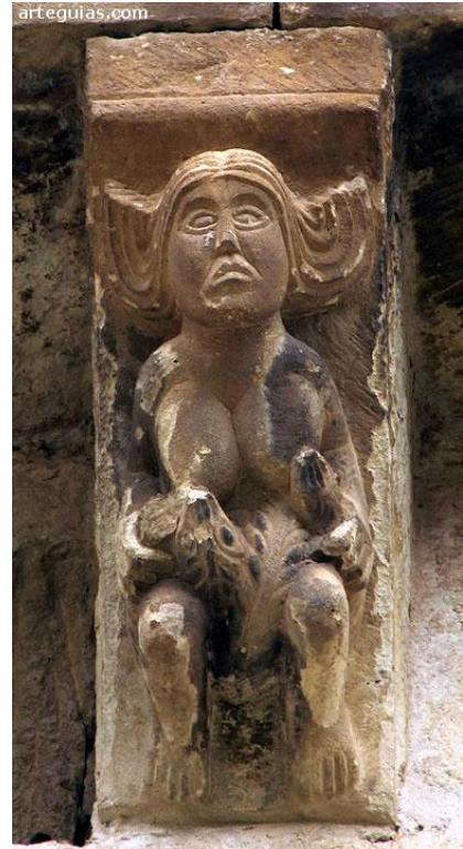
3. Irudia. Tejadako San Petriko harbua. harburua. (Burgos) XII.mendea.