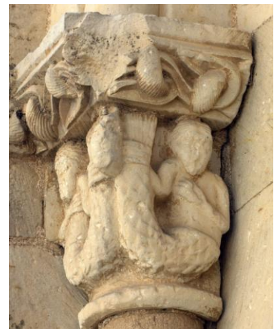
10.Irudia. San Joan Bataiatzailearen elizako kapitela. Cerezo de Arriba. (Segobia). XII.mendea.