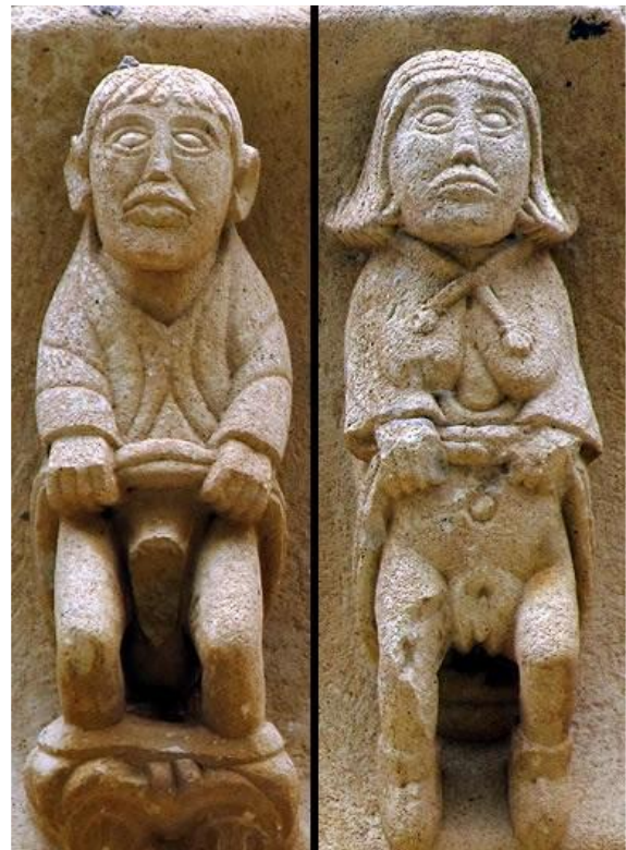
4. Irudia. Tejadako San Petriko harburuak. (Guadalajara) XIII.mendea.

Emakumeen kasuan, jarrera ezinezkoetan agertzen zaizkigula da deigarriena, haien hankak buruen aldeetara eramanez, horrela, sexua guztiz agerian utziz. Eskultoreek genitalen tamaina exageratzen