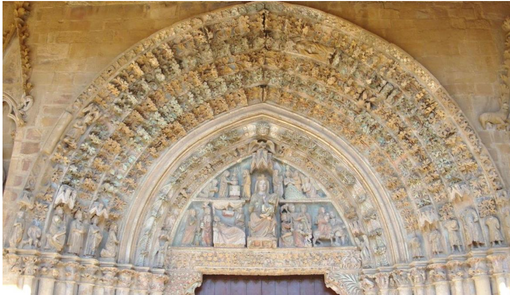
4. IRUDIA. Erriberriko Andramariaren errege-elizako ataurrea. Ikuspegi orokorra.

Erriberri, Nafarroako izen bereko merindadeko hiriburu, errege-egoitza izan zen denbora luzean zehar. XIV. mendearen aurretik, bertan errege-gaztelu bat existitzen zen, gotorleku moduan erabiltzen zena, hasierako Gotikoan eraikia. Honen parean, estilo Gotiko betearen hasieran eraiki zen Andramariaren eliza, Nafarroan jada hamarkadak zeramatzan errege-etxe frantziarraren eraginez 49 . Halaber, Karlos III.a erregeak gazteluaren inguruan eraikuntza erraldoiak agindu zituen, Errege-jauregia sortuz, gorteko eraikin moduan, modu erresidentzial batean ikusita. Obra hauek asko luzatu ziren, bere agintaldi osoan zehar, alegia, 1390 ingurutik 1420 hamarkadara arte 50 . Gauzak horrela, Nafarroako Gorteen egoitza izan zen ere urte askotan zehar, egoitza oso garrantzitsua, beraz, lurraldeko administraziorako. Bertan dagoen Andramariaren eliza errege-eliza moduan ulertu behar dugu, izan ere, jauregi berriaren eraikuntzarekin pasabide bat sortu zen jauregitik zuzenean elizaren korura iristeko, errege-balkoi