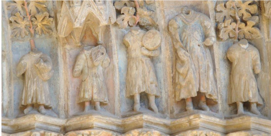
5. IRUDIA. Erriberriko Andrmariaren errege-elizako ataurrea. Artzain-musikariak.

Barrualdeko lehen arkiboltan (musikarien irudiei dagokienez), lehen artzainak kornamusa jotzen du (ikus 5. irudia) 54 . Izen ugariko tresna: gaita, kornamusa, zahagi edo zatuzko gaita, etab., tresna garaikideak egun ezagunak diren Galizia edota Eskoziako gaiten antzerakoa lirateke 55 . Larruzko zahagi batera (zatua) ahotik zuzeneko airea sartzen da, eta bi pieza irteten dira poltsa honetatik: klarina (melodia sortzen duen pieza, dultzainaren antzeko bat) eta pordoia/k (soinu jarraia sortzen duen zulorik gabeko klarin luzeagoa) 56 . Kasu honetan, kontserbazio egoerarengatik zatua soilik kontserbatu da, baina besoen posizioarengatik oso agerikoa da eskuekin klarin luze bat jotzen ari zela. Lehen ikusi dugun bezala, musika-tresna honek bere loraldia lortu zuen XIII. eta XIV. mendeetan, Donejakue Bideari esker eta baita orduan ere agintean zegoen frantziar errege-etxearen eraginez. Orduetik XVII. mendera arte Nafarroan oso erabilia izan zen musika tresna dugu, Erdi Aroko juglare eta gorte-musikan ere guztiz ezinbestekoa 57 .