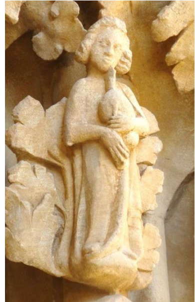
10. IRUDIA. Uxueko eliza-gotorlekuko kornamusa-jotzaileetako bat.

Honekin, eraikuntza monumentaletatik at, interes historikoa duten beste zenbait irudi ere aztertzea egokia izan da, ikuspegi orokor honetan bestelako adibide esanguratsuak ere kontuan izatearren.