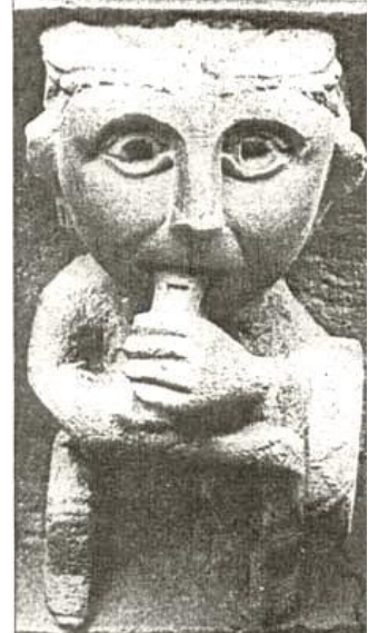
9. IRUDIA. Olivako Monasterioko harburuko "txistularia".

Zarrakaztelu aldean dagoen Olivako Monasterioan dagoen irudi bati egingo diogu erreferentzia. XIII. mendearen inguruan eraikia, zenbait atal XIV. mendekoak izanik, Nafarroan dauden monasterio zistertarren adibiderik esanguratsuenetarikoa dugu 74 . Eliza, klaustroa eta beste areto original ugari kontserbatzen dira, baita dekorazio oparoa ere. Horien artean, monasterioaren kanpoaldea inguratzen duten harburuetan dauden irudiak dira aipatzekoak. Ohikoak diren bekatuen irudiak, animalia eta munstroak, baita musikariak ere. Kasu, aipatzekoa da txistularia izan daitekeen irudia 75 . Izan ere, bere ezkerreko eskuaz txirula luze bat darama, eta eskuinekoaz danbor txiki bat jotzen ageri da, perkusiozko tresna hau bere ezkerreko besotik heltzen delarik (ikus. 9.