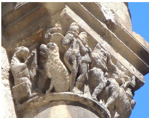
8. IRUDIA. Lizarrako Nafarroako errege-erreginen Jauregia. Asto arpa-jotzailearen kapitela.

Lizarrako Nafarroako Errege-erreginen Jauregia lurraldean kontserbatzen den eraikin zibil erromaniko bakanetakoa da. XII.-XIII. mendeetan eraikia, Antso VI.a Jakitunaren garaian, Iruñeko eta Nafarroako errege-erreginen egoitza izan zen 72 . Zenbait leiho hirukoitzek osatzen duten konposizioan, hiruna zutabetxo dituztela, guztietan kapitelak dekoratuak