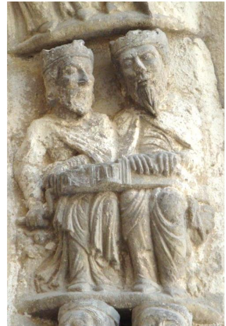
3. IRUDIA. Lizarrako San Migel elizako ataurrea. Organistruma.

Adibide bitxiagoa aurkitzen dugu hurrengo eszenan, justu arkuzko biolaren gainean dagoena, Erdi Aroan oso ezaguna eta herrikoia bilakatu zen musika-tresna batekin. Agure bikote hau organistrum tresna jotzen ageri da (ikus. 3. irudia). Biradera bidezko kordofonoa 40 , kutxa baten babesean hariak gurpil batek irristatuz soinua sortzen dela, klabe edo egurrezko “iltze” batzuek zanpatuz soinu baxu eta altuagoak sortzen dituen. Egun zarrabete edo zanfona izenarekin ezagutzen den tresnaren aitzindaria, IX. mendean jada