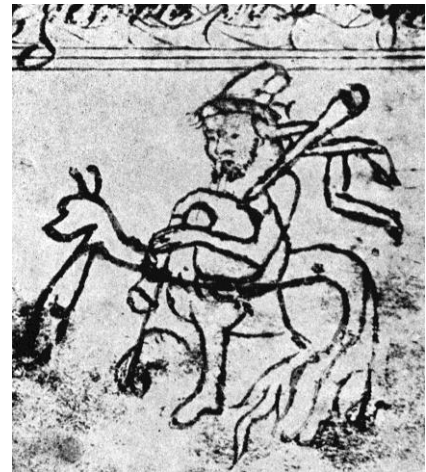
1. IRUDIA. “Batasunaren Pribilegioa”-ren dokumentuan ageri den zaldiko-musikaria.

Musikaren presentzia nabaria zen, beraz, Erdi Aroko egunerokotasunean. Funtzio erlijioso zein zibiletan era askotako musikak jotzen ziren, herri xeheak berak zuzenean entzuten zituenak. Bestetik, festa eta errito egunetan, zein eguneroko merkatu eta ferietan karriketan gora eta behera ibiltzen ziren kaleko musikari eta antzerkigileek ere kantu zein musika-tresna ugari erabiltzen zituzten, hauek ere guztiz ikusgai zirenak, bada 3 . Zuzeneko elementua eta hainbesteko presentzia izanik, ez da harritzekoa egun arte iritsi zaizkigun zenbait elementutan agertzea.