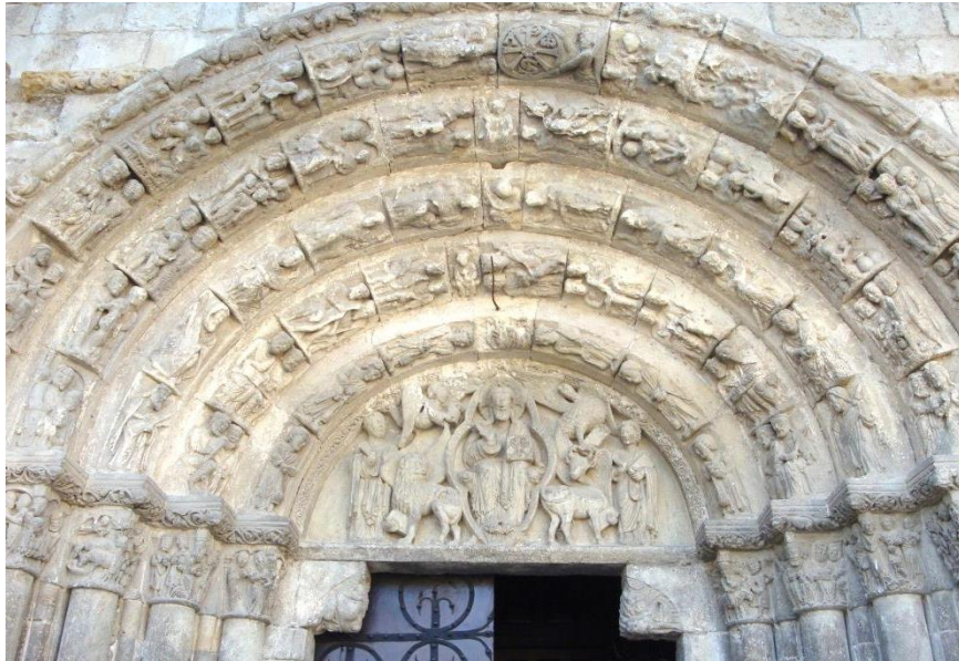
2. IRUDIA. Lizarrako San Migel elizako ataurrea. Ikuspegi orokorra.

eraikuntzaren prozesu luzearengatik-edo, noizbait desmuntatua eta berreraikia izan zen, zenbait eszenen kokapen ilogikoak adierazten digunez 33 .