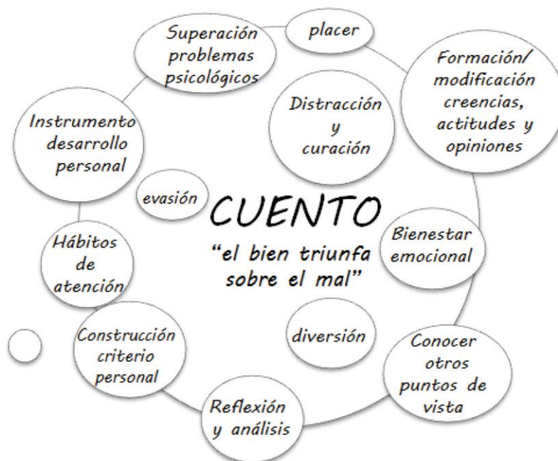
1. irudia: Haur Literaturaren onurak

Aipatutako Haur Literaturaren onurak Hernández eta Rabadán-ek (2014) idatzitako artikuluan aurkitutako aurreko eskema honetan (1.irudia) laburbiltzen dira. Hala eta guztiz ere, onura guzti hauetaz baliatu ahal izateko oso garrantzitsua da ipuinen hautaketa egokiak egitea. Izan ere, Wopperer-ek (2011) azaltzen duen moduan: “Children want to be able to relate to the character they are reading about and looking at in the illustrations. For young children with disabilities, this is harder if the character does not look and act like them.” Blackston-ek (2003) azaltzen duen moduan, elbarritasunak barneratzen duen literatura “It has the potential to enhance inclusive environments”, betiere pertsona hauen onarpena ulermena eta miresmena transmititzen duten ipuinak izanda.