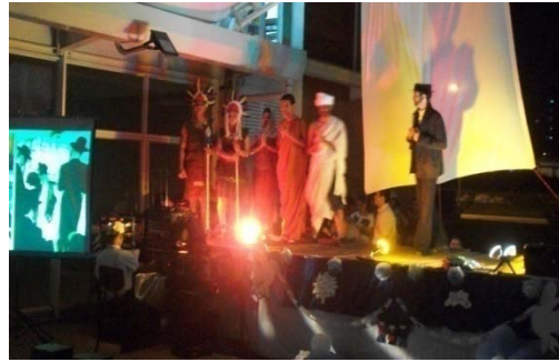
Fig. 5. Dramatización sobre las religiones