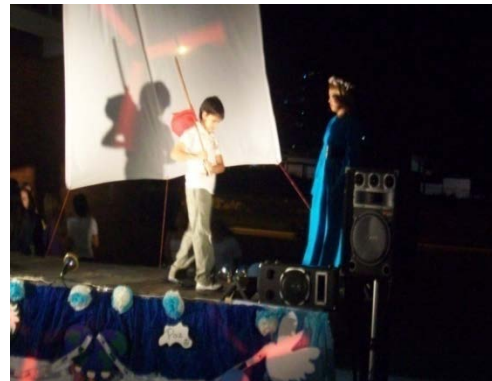
Fig. 3. Primera dramatización: Relación del ser humano con la madre tierra.