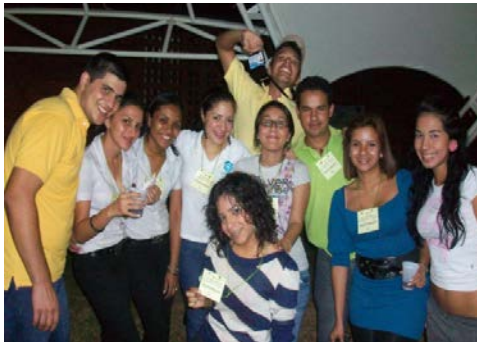
Fig. 8. Beneficiarios del proyecto.