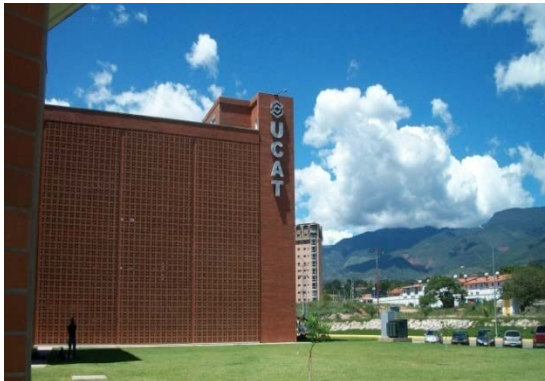
Fig.2. Sede del proyecto