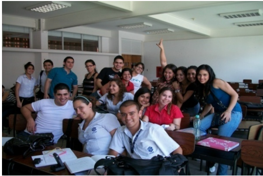
Fig.1. Estudiantes que formaron parte del proyecto.

Secuencia fotográfica con el grupo de estudiantes que colaboró en la organización y ejecución del proyecto artístico: Unidos por la paz a través del arte . Se muestran también algunas escenas centrales de la obra artística en desarrollo.