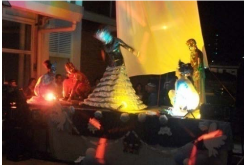
Fig.4. Homenaje a la tierra.