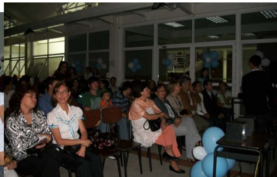
Fig. 9. Público asistente