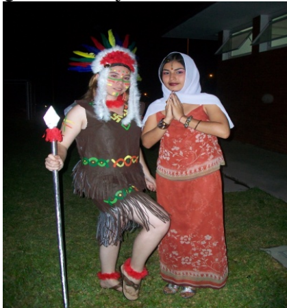
Fig. 6. Culturas en diálogo