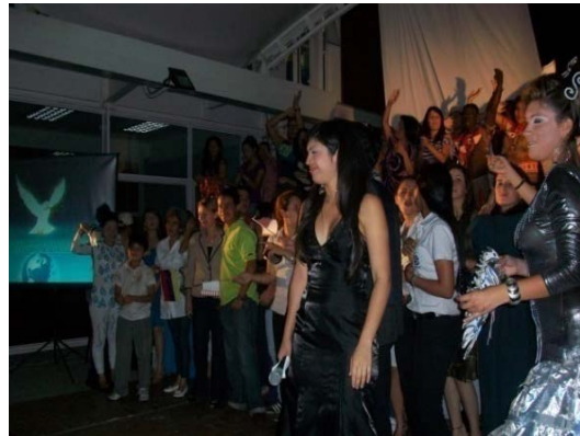
Fig. 7. Momento fraterno