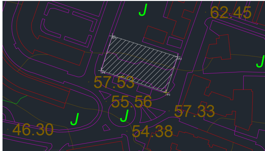
1. Irudia: Aparkalekuaren kokapena

Aparkalekua kokatuta joango den eremuaren erliebea 1. eta 2. Irudietan agertzen dena izango da: