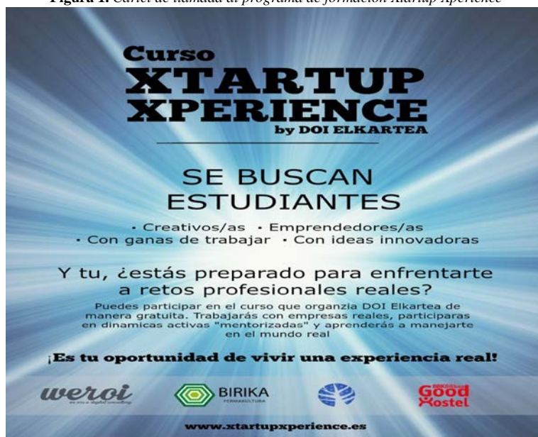
Figura 1. Cartel de llamada al programa de formación Xtartup Xperience