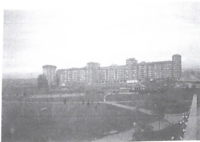
Foto 59. Poligonos Penitencos. 4ª Generación. Arriaga (Lakua L-13).