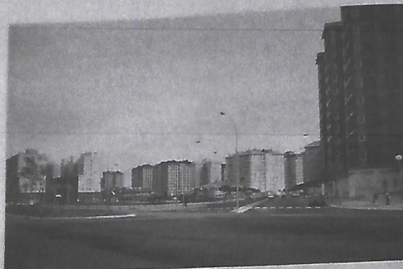
Foto 58. Polígonos Periféricos. 4.ª Generación. Sansomendi. (Lakua).

desde 1977 hasta 1980 se ofertaron 354 viviendas, entre las que predominan las medianas y después las grandes (Cuadro IV-58) de manera que no sólo por el momento tardío, sino también por el equilibrio existente en el suelo residencial de la ciudad el pequeño retazo tuvo una mayor valorización, de ahí el tipo de oferta inmobiliaria. No en vano el resto de los polígonos periféricos ya comenzaban a localizarse en una segunda Vitoria, la que se acoplaba al Noroeste a través del Actur de Lakua. (Foto 57).