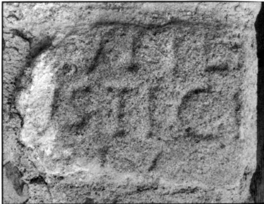
FIGURA 4. Fotografía de CIL II 689 tal como aparece en CILC II, 712