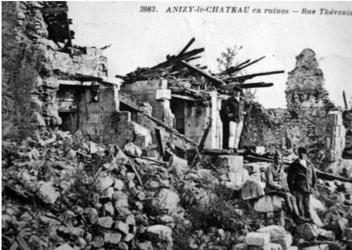
Carta postal, Caja A, Historial de la Grande Guerre (Péronne), SA.

censura francesa autorizó la publicación de miles de fotografías y de cartas postales que mostraban las destrucciones provocadas por la artillería alemana 24 , en Euzkadi , en cambio, se produjo una evolución notable en el uso de las fotografías y los valores que éstas difundían.