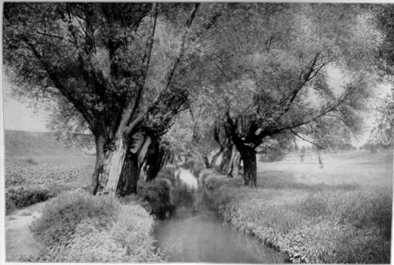
Illustrirte Zeitung , 14 de junio de 1917, p. 794.

Estas imágenes, en su opinión, justifican el sacrificio de los combatientes al mostrar todo lo que preservan los soldados alemanes. Se trata pues «de conseguir que la vista se aparte de la monstruosidad del conflicto para que se centre claramente en las ventajas que conlleva el enfrentamiento y, de esta manera, convertir la guerra en algo trivial» 37 . El caso vasco es semejante. Las fotografías de Ojanguren desempeñan la misma función. Describen un País Vasco mítico, amenazado por una invasión y que hay que defender a cualquier precio. Sin embargo, en Euzkadi, la prensa va más lejos que la prensa alemana de la Primera Guerra Mundial, puesto que manipula las fotografías para que el espectro de los combates y de las devastaciones se infiltre en las imágenes y reoriente el primer significado de los clichés. Los paisajes y los edificios ya no son el reflejo de la realidad, sino el espectro de lo que fueron en su tiempo, antes de que empezara la guerra. Para conseguir este resultado, los diarios introducen un nuevo elemento, el pie de foto, ausente en las fotografías originales: