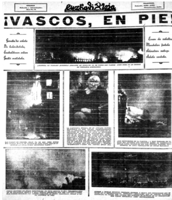
«¡Vascos en pie!», Euzkadi Roja , 28 de abril de 1937, p. 8

Las fotografías del incendio de Guernica constituyen el punto culminante de una campaña de propaganda en la cual las ruinas son instrumentalizadas para denunciar al enemigo y para movilizar a los antifascistas, pero también para hacer reaccionar a la opinión internacional e incitar a las principales potencias militares de la época (Francia e Inglaterra) a intervenir en el conflicto 29 . Por consiguiente, las imágenes del bombardeo del símbolo de las libertades vascas son ampliamente difundidas en el ex-