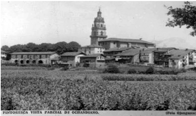
«Pintoresca vista parcial de Ochandiano», El Noticiero Bilbaíno , 11 de noviembre de 1936, p. 1.

La Primera Guerra Mundial se convierte en un referente que orienta las principales representaciones que se transmiten sobre la guerra en Euzkadi. Otras prácticas comunicativas lo corroboran asimismo, tales como la publicación en la prensa nacionalista y en los diarios incautados por las autoridades vascas —o incluso en la prensa rebelde— de numerosas fotografías a primera vista anacrónicas, pero cuya dimensión simbólica articula un discurso esencial para forjar una imagen distinta de la guerra y de sus consecuencias.