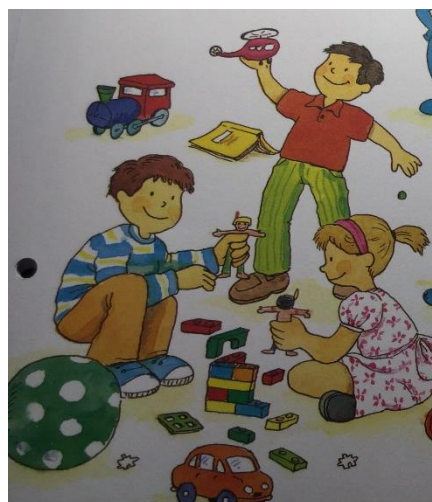
3.irudia: gizonezkoak prakekin (%62) eta emakumezkoak (%49) soinekoa/gona/amantalarekin irudikatzen dira.

67 amatatik, 18k soinekoa edo gona zein amantala daramate, 30ek prakak eta 3k bainujantzia edo mozorroren bat. 100 aitetatik 5ek baino ez daramate amantala (lanerako buzoa eta antzekoak), gona edo soinekoa daramanik ez baita ageri. % 72ak prakak daramatza eta 8k bainujantzia edo mozorroa. Semeen % 9ak amantala darama, aiten kasuan bezala gona edo soinekorik ez daramatelako. Gehiengoak, 149tik 96k edo % 62ak, prakak daramatza eta gainerako %16ak bainujantzia edo mozorroa % 10. Ia alaben erdia, % 49ak hain zuzen ere, soinekoarekin, gonarekin edo amantalarekin ageri da, % 21a prakekin eta %9a bainujantzi edo