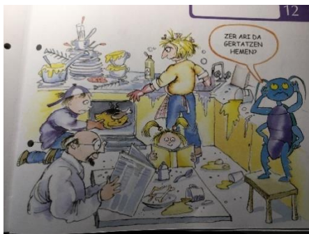
4.irudia: emakumea harrakoa egiten eta gizona aldizkaria irakurtzen.

Ikerketa honen bitartez, Urtxintxa argialetxeak, Euskal Herriko hezkuntza