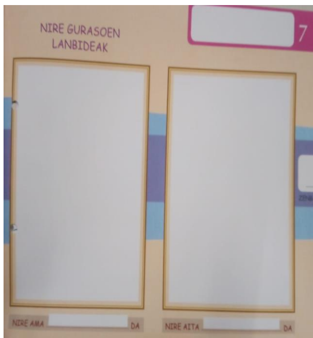
6.irudia: "Nire gurasoen lanbideak" jardura.

agertzen dira eta 6 kasutan, aitarekin bakarrik (ikus 5.irudia), halakoetan ama eta aita bakarrekoko familiak direla egintzat jo da. 5 familia sailkatu gabe geratu dira, ez baitago argi bere senideak zeintzuk diren. Azpimarragarria bada ere, azal zurikoa ez den familia bakarra txiro eta tribal bezala irudikatzen