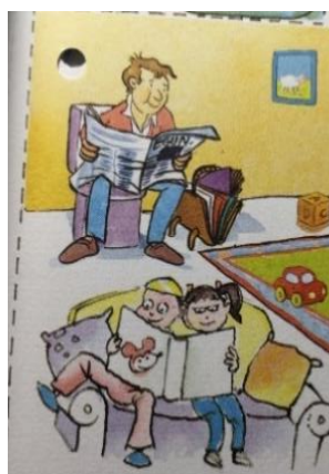
5.irudia: aita bakarrekoko familia.

Egoera kezkarri honek, euskal neska-mutilei ikasmaterialen bidez ematen zaien eredu enpresa txikia baino ez da, ipuin tradizionalak (Haur Hezkuntzan ohikoenak direnak) ez baitute egoera hobetzen. Mutilak hurrengo eredu enprean jartzen ari gara: indartsua, ausarta, heterossexuala, ile laburra eta/edo ez orraztua, soineko edo gonarik ez daramana eta bihurrikeriak zein gaiztakeriak egiten dituen. Haatik, mutilak jarrera dominante hori duten bitartean, neskek bestelako apaltasun eredu enprean jartzen dira: zintotasuna, ongia egin beharra, etxeko lanen zein erosketen arduraduna, ile luzea eta soinekoa edo gona, ondo orraztua eta pinpirina. Hurrez gain, orokorrean gizon eta emakumeen artean ere desberdintasunak nabarmenak dira, hiru adin tartetan gizonak dira nagusi, lan gehiago egiten dute eta atsedeen gehiago hartu.