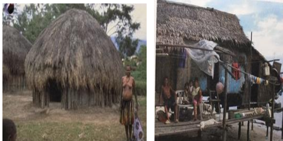
2.irudia: liburuxketan agertzen diren pertsona ez-zuri guztiak txiroak dira. Iturria: Urtxintxa.

taulan: liburuxketako pertsonaia kopurua eta ekintzen maiztasuna , eremu bakoitzean adin eta sexu jakin bateko kolektibo bat nagusitzen delarik. Adinaren eta sexuaren arabera, pertsonak ama, aita, semea, alaba, aitona eta amona gisa sailkatu dira eta guztira 67 ama, 100 aita, 149