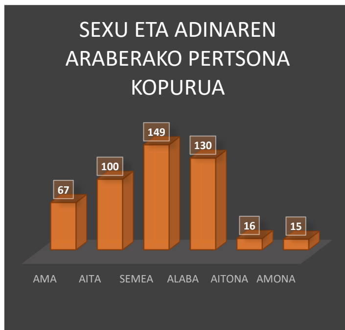
2.grafikoa: sexu eta adinaren araberako pertsona kopurua. Iturria: Urtxintxa.

Kalean, eskolan edota etxean hurrekin egoten, bai maiztasunetan bai proportzioan amak dira gailentzen direnak, % 9, maiztasunean atzetik aitak dituzte eta aitona eta amonak berdinketan amaieran. Aipatu beharra dago eremu honetan ez direla haurrak kontuan hartu, haurrak beti agertzen baitira beste haur batzuekin.