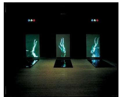
4.irudia. Estazioak ( Stations , 1994).

Hamarkada honen baitan azaldutako azkenengo lana Estazioak ( Stations , 1994) izango litzateke. Estazioak (4. irudia) bost pantailaz osatutako bideo instalazioa da eta pantaila horien aurrean edo azpian, lurrean hain zuzen ere, granitozko beste bost plaka beltz kokatuta daude. Oraingoan, xehetasun ezberdin batzuk ageri dira aurreko bideo artelanetan aurkitzen ez direnak. Alde batetik, irudien proiektzioak kolorezkoak dira eta ez txuri-beltzean. Bestalde, soinua dago, hori bai, ura eta ur azpiko marmarrak soilik entzuten dira.