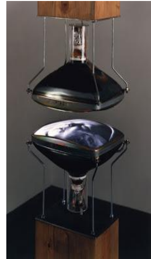
3.irudia. Zerua eta Lurra (Heaven and Earth, 1992).

bideo instalazioa bi telebista pantaila edo monitoren osatuta dago. Monitoreak aurrez aurre kokatuta daude, bost zentimetrora zehazki eta egurrezko koloma baten tartean kokatzen dira, koloma sabaira eta lurrera helduz. Telebistek ez dute karkasarik, hau da, telebistek ez dute pantailaren atzean kokatzen zaien armazoi edo egiturarik. (3. irudia) Monitore hauetan bi irudi txuribeltzean proiektatzen dira, bakoitzean bat. Goyaldean adindun bat hiltzen agertzen da eta beheko monitorean, aldiz, ume baten jaiotza. Bi monitoreak aurrez aurre hain hurbil kokatuta daudenez, irudiak bata bestearen gainean proiektatzen edo erreflexatzen dira, irudiak gainjarriz. 64