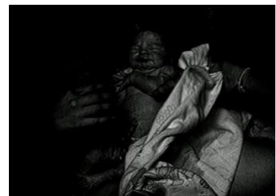
1.irudia. Igarotzea ( The Passing , 1991).

Hamarraldi honen lehen obretako bat Igarotzea ( The Passing , 1991) izan zen. 54 minutu irauten duen bideo artelan bat da, txuri-beltzean egindakoa. Lan honetan plano ezberdinak erabiltzen ditu, nahasiz. Ehundura eta kolore ezberdinak filmatu (nahiz eta txuri-beltzean izan gris eskala ezberdinak nahasten ditu) eta naturako elementu ezberdinak errepresentatzen ditu, ura gehienbat. Bideo lan honetan irudi ezberdinak ikusten dira. Askotan, irudien artean inolako konexiorik ez dagoela pentsa daiteke sekuentzia batzuk oso zorizkoak direlako, baina beste batzuetan, aldiz, erlazioa edo konexioa nabaria da. 54