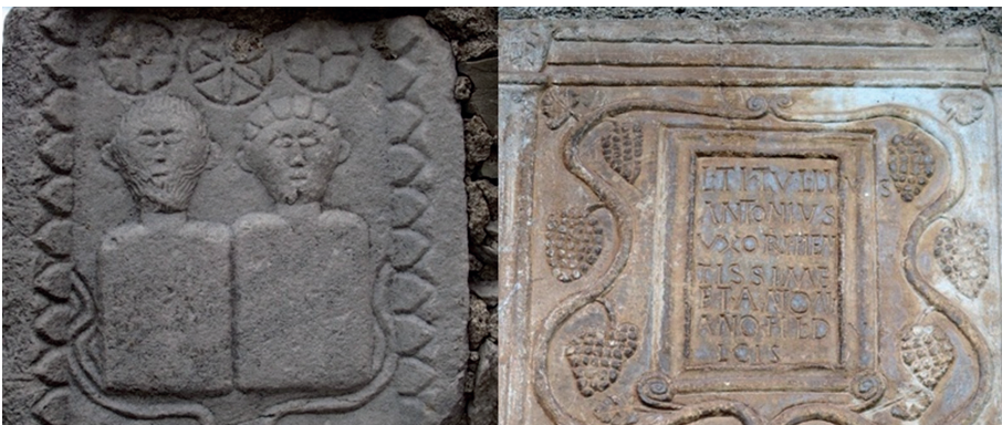
Fig. 2.- Iconografía de racimos en lápidas de la época romana: Chapelle Saint-Julien, Saléchan (Hautes-Pyrénées) y église de Billière (Haute-Garonne).

Los sarmientos se han empleado para la fabricación de maromas (Quer, 1784) y aros para la construcción de nasas de pesca en el litoral asturiano y gaditano hasta hace dos décadas.