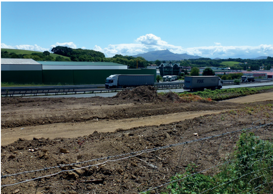
Fig. 3.- Zona de bosque devastada en el barrio de Acotz (carretera D810).