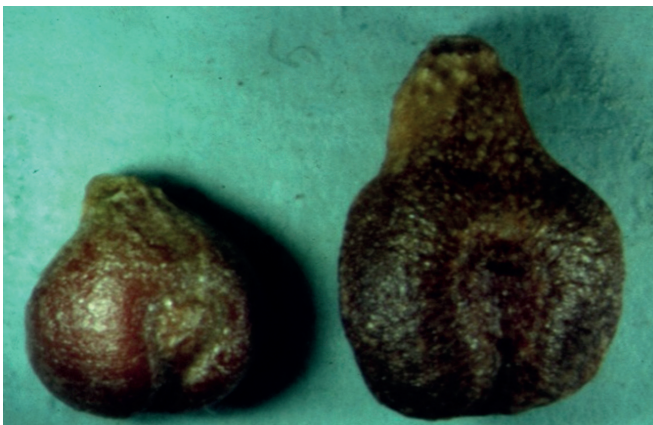
Fig. 6.- Semilla de vid silvestre (izquierda) y cultivada (derecha).

Los racimos de las plantas femeninas son de pequeña talla y siempre tintas, generalmente flácidas, por falta de fecundación de algunas flores. Las bayas son de pequeño tamaño y poco uniformes, de color vino tinto. Su forma es subsférica, con un diámetro máximo de aproximadamente 1 cm. Por lo general las semillas son bastante menos alargadas que las que provienen de las variedades cultivadas, con la chalaza más corta (Fig. 6), como aparece bien reflejado en las conclusiones sobre la morfología de la muestra de semillas de otras zonas francesas analizadas por el INRA de Montpellier (Terral et al. , 2010). El número de semillas por baya varía de 1 a 3.