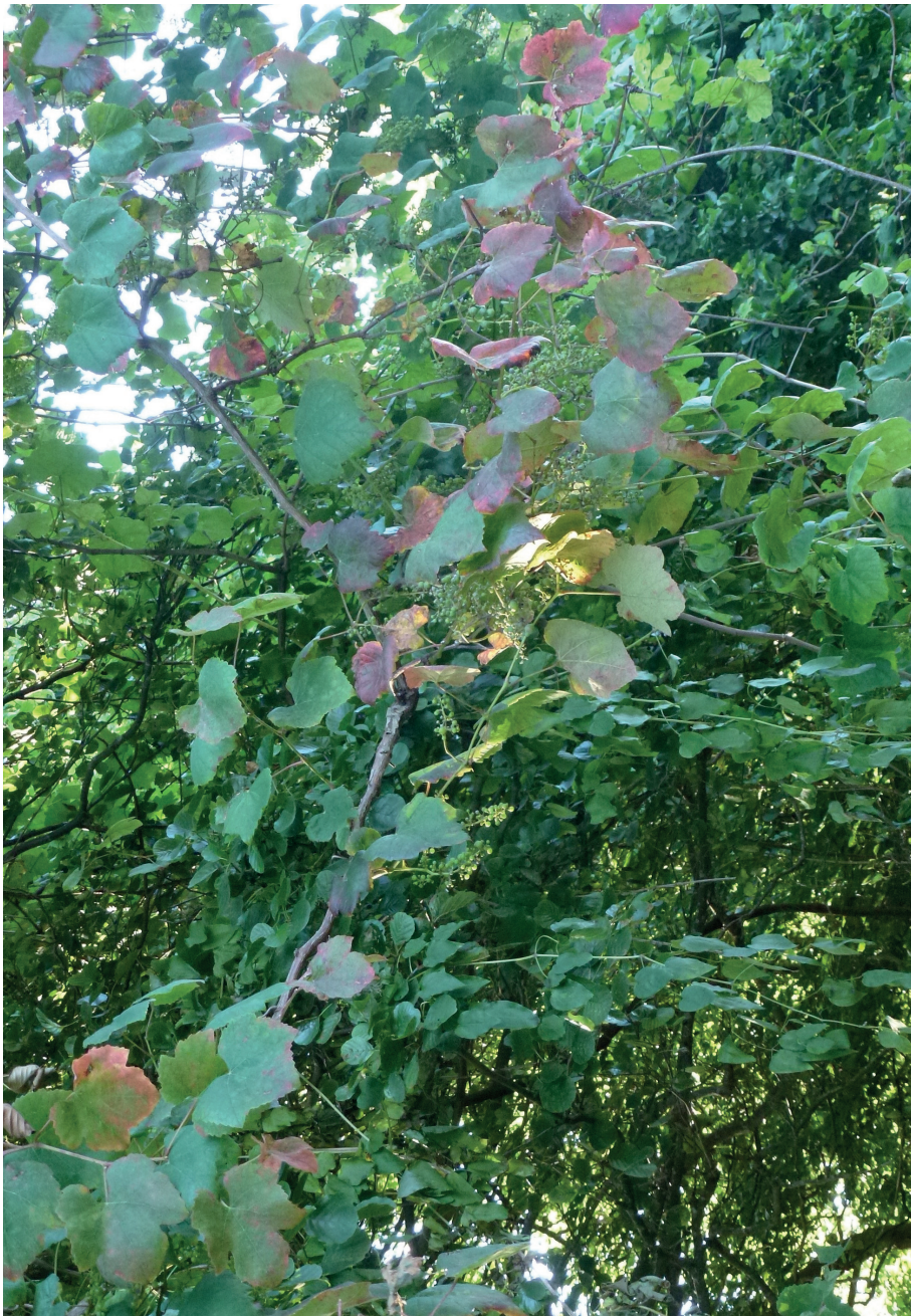
Fig. 5.-Ejemplares de vid silvestre sobre sus tutores en las inmediaciones de Sokoá.