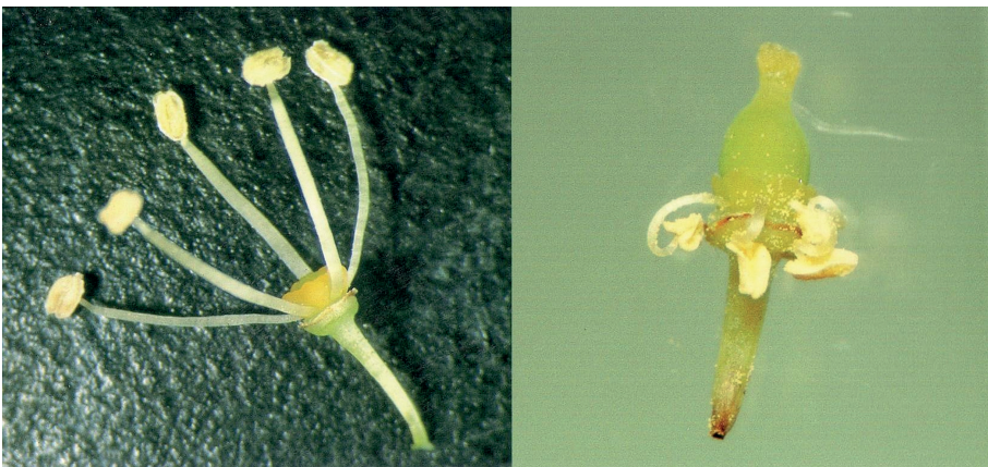
Fig. 1.- Flor masculina pura (izquierda) y flor femenina con estambres reflejos (derecha).

En otras zonas geográficas, como es el caso de Norteamérica y el este de China, existe un mayor número de especies silvestres autóctonas de vid. Una explicación de ello sería que los diversos periodos glaciares a lo largo del Cuaternario influyeron en la distribución de