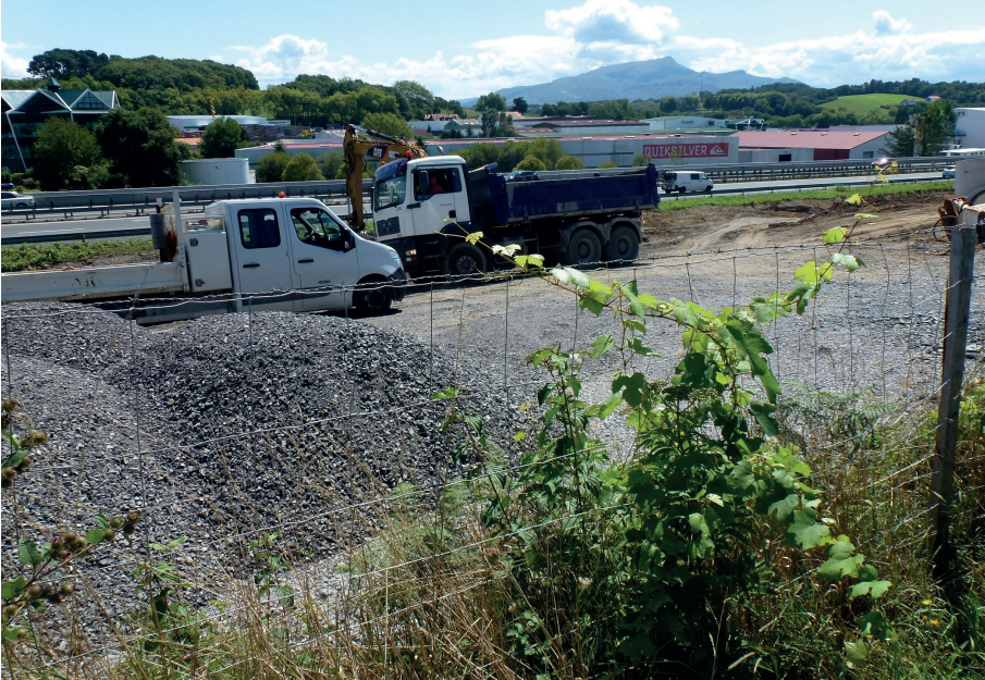
Fig. 4.- Nuevos brotes procedentes de parras cortadas en la zona de la figura anterior.