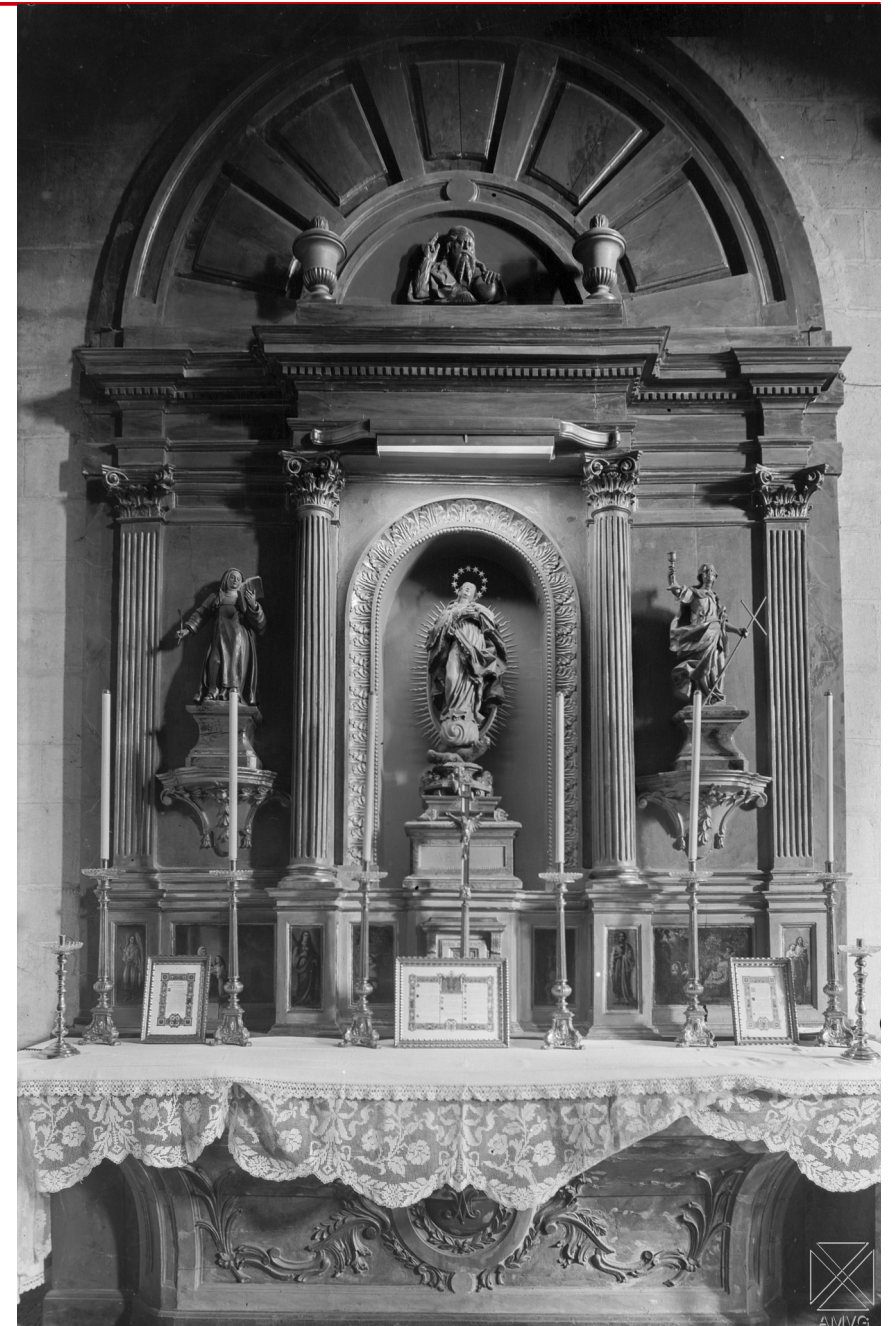
Fig. 3: Retablo de la capilla de la Concepción de la catedral de Santa María de Vitoria-Gasteiz. Archivo Municipal de Vitoria-Gasteiz Pilar Aróstegui. GUI-VIII-47_0. Enrique Guinea Maquibar