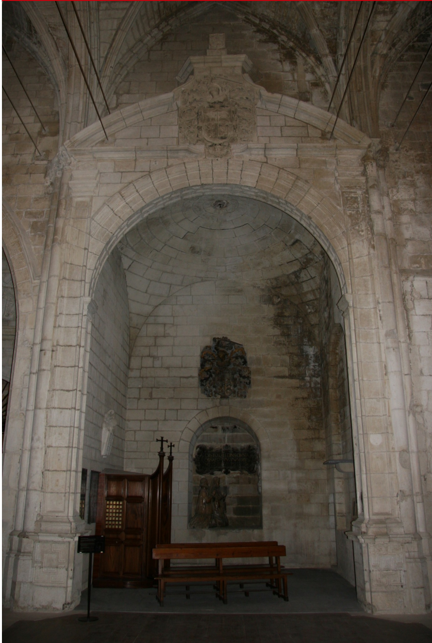
Fig. 2: Capilla de la Concepción de la catedral de Santa María de Vitoria-Gasteiz

destacado como contemplaba la carta de dación. Para los sepulcros emplearon el modelo orante genuflexo, con lo que pretendían reforzar su posición y exaltar su persona inmortalizando su imagen y con ello su notoriedad entre la oligarquía y la sociedad vitoriana. El conjunto se complementa con una cartela informativa y un Crucificado a modo de altar frente a los orantes. Estilísticamente este nuevo espacio arquitectónico creado por Gabriel Ortiz de Caicedo y su esposa Ana de Arana para la capilla de la Concepción supone un anticipo del clasicismo viñolesco que tendrá su máximo exponente en Álava en el convento de la Purísima Concepción de Vitoria (1611).