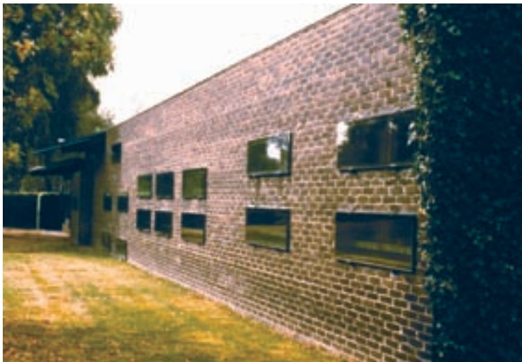
6 Fachada con los huecos de ventana.

Desde las estancias de carácter recogido, protector, cálido y hasta poderoso en sus texturas, el muro debía recortarse y permitir la entrada de luz, de un modo directo. Suprimió la carpintería, de modo que los marcos, al no existir, dejaban el muro recortado, como una oquedad. Colocó sobre esa oquedad, en el exterior, un vidrio, pegado con masa sobre el muro, como taponando la oquedad. De este modo, las ventanas desde el exterior parecen cuadros, que resaltando del muro se pegan al mismo, enmarcados por la masa. Y desde el interior se produce la sensación de la no existencia de un cerramiento, sino de una oquedad en contacto directo con el exterior.