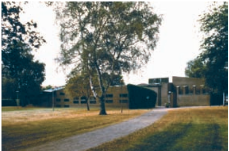
7. Fachada posterior del conjunto.

Desde 1943, a la edad de 58 años, con sus hermosas capillas de San Canuto y Santa Gertrudis, en el Cementerio Oriental de Malmö, Lewerentz llegó a su extraordinaria obra de San Marcos en Björkhagen. San Pedro en Klipan cierra la obra de este arquitecto, con unas cotas de sensibilidad difícilmente igualables en la arquitectura sueca.