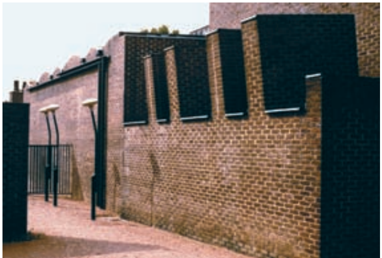
5. Fachada con los volúmenes de chimeneas-tragaluz.

Creo que es preciso señalar que ese movimiento romántico que vuelve su mirada hacia las grandes obras del pasado, descubre en ellas un rasgo que a veces nos pasa desapercibido, y es precisamente el del hermetismo de los grandes ejemplos de la historia de Suecia. El carácter de fortaleza, de protección, no sólo frente a los enemigos, sino a la propia climatología de un país azotado por las nevadas y los vientos de los largos inviernos. Quizás con ojos actuales resulte más difícil entender esa búsqueda de