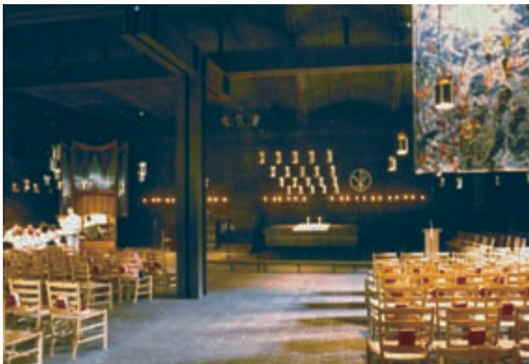
4 Vista del interior del santuario.

El altar se presenta inmediato, como parte de la sala. No está diferenciado ni por la elevación propia de un presbiterio, ni por el fondo ocupable por un retablo, ni por cualquier otro atributo más allá que la mera mesa. La oscuridad, el aire opresivo, la rusticidad, etc., todo contribuye a generar esa atmósfera de hermandad entre todos los asistentes.