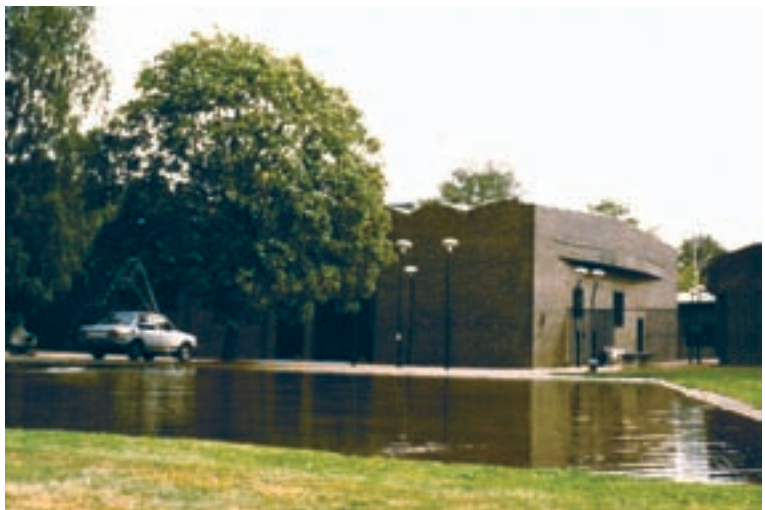
3. Vista de la iglesia desde el acceso.

El espacio, de reducidas dimensiones, es opresivo no sólo por la altura, sino también por su hermetismo. La planta del santuario es un cuadrado