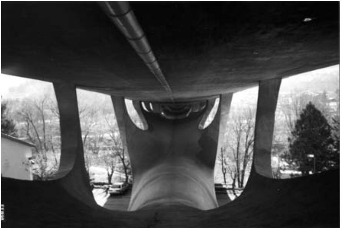
Espacio comprendido entre la cáscara y la plataforma.

excelente comportamiento de la forma estructural diseñada frente a acciones inesperadas, alcanzándose la rotura cuando el peso propio y la sobrecarga aumentaban en un 100% su valor original.