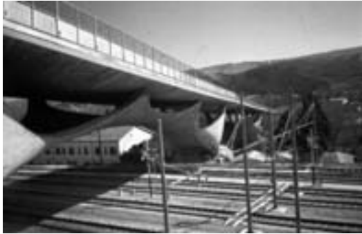
Vista del puente de Musmeci hacia el río Basento en Potenza. (1998).