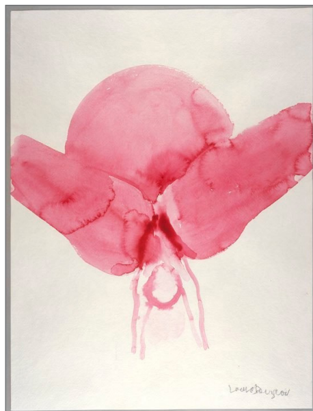
Louise Bourgeois El Nacimiento , 2007 Gouache sobre papel 23 1/2" x 18" Gallery Paule Anglim, San Francisco and Cheim & Read, New York ©

En la última década de su vida abordó la función reproductiva de la mujer, entre sus obras destaco aquí una obra perteneciente a una serie de pinturas en las que utilizaba sobre todo gouache rojo. Louise Bourgeois hablaría de su madre, su padre y sus hijos como sus tres marcos de referencia 3 .