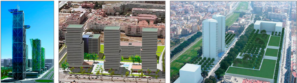
Imagen 3 (apartado 3.3). Las torres y sus conjuntos proyectados en Repsol, La Térmica y Martiricos. En este último, solo se aprecia el volumen genérico de las dos estructuras gemelas, sin que se especifiquen sus detalles estructurales ni arquitectónicos.

se alza al sur del terreno. Los otros dos viven situaciones distintas: en el del paseo marítimo, los derechos edificatorios pasaron a la Sareb, transfiriéndose recientemente al grupo Metrovacesa; el de los terrenos de la industria energética está en suspenso tanto por la quiebra de la promotora como por la falta de consenso municipal, unido a la posible contaminación de los suelos. De todas formas, los tres proyectos cuentan con un planteamiento integral de renovación urbanística, uniéndose a las torres-rascacielos otros equipamientos, espacios públicos y amplias zonas verdes.