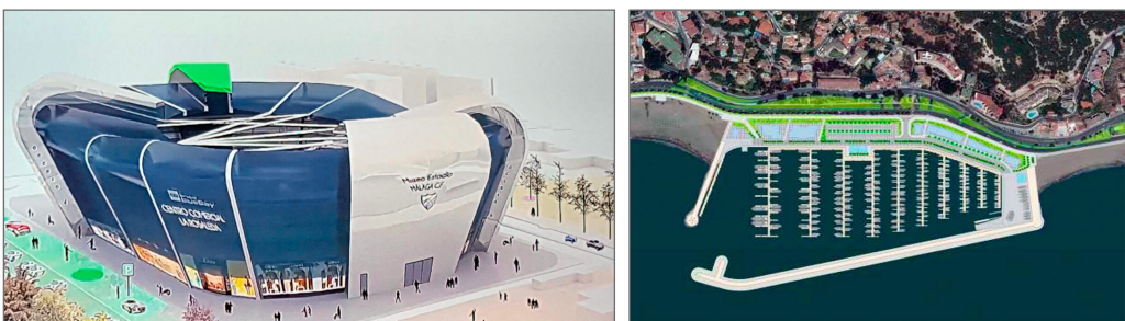
Imagen 1. La Rosaleda proyectada por Blue Bay y el Puerto deportivo de El Morlaco.

El way of live de los habitantes de un entorno está marcado por sus pasatiempos. Málaga presume de su afición por el 'deporte rey' nacional y su situación costera proporciona condiciones especiales para el deporte náutico.