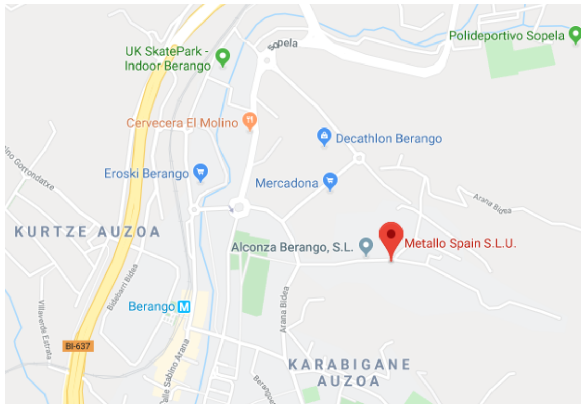
Ilustración 3.1. Ubicación Metallo S.L.U.

El proyecto pertenece a la solicitud hecha por la empresa Elmet S.L.U, actualmente con nombre Metallo Spain S.L.U., con domicilio en barrio Arene 20, en Berango, para la redacción de cierre y cubrición de espacios anexos a la nave 1.