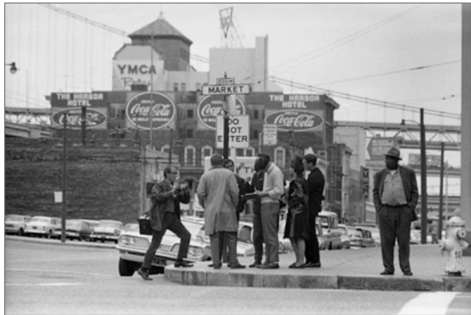
Fig.2 Market Street Experiment in Environment (1966)