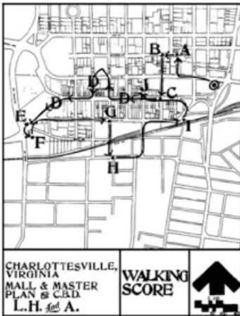
Fig.1 Taking Part Walking Score

Los procesos de trabajo resultantes de los talleres Experiments in environments dieron lugar a la propuesta de los RSVP Cycles , una forma participativa de construir comunidad mediante la sensibilización de los condicionantes espaciales y de las tensiones sociales que surgen en el proceso de trabajo. Así mismo, esta metodología trataba de facilitar la comunicación y la colaboración entre los participantes de diferentes disciplinas, poniendo en cuestión sus respectivas formas de construcción de los objetos de investigación (Bal 2002).