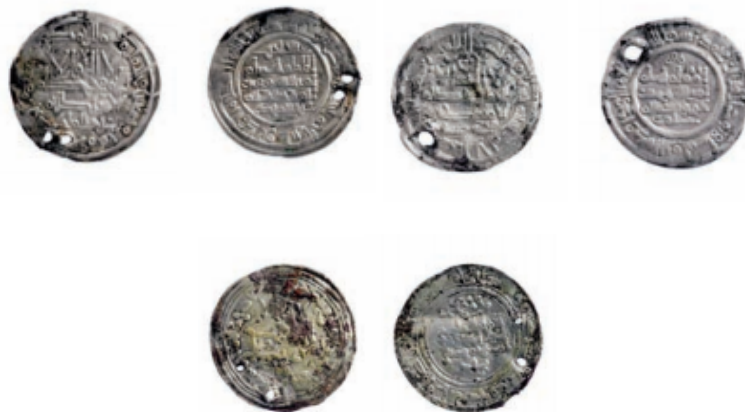
7., 8. eta 9. irudiak: Hurrenez hurren, ʿAbd al-Raḥmān III, ʿAbd al-Ḥakam II eta Hišām II garaiko dirhamak (Faro, García-Barnerena eta Unzu, 2007-8:272 [44])

Hilobiratzeak kale paraleloen arabera zeuden antolatuta, eta guztira 2.100 m 2 -ko azalera hartzen zuten (Faro, García-Barnerena eta Unzu, 2007-8:268). Hurbilketa kronologiko batek XI. eta XIII. mendeen artean kokatzen ditu aztarnak, eta guztira hauetako %10etan hatua identifikatu zen zeinen barruan 9 txanpon arabiar identifikatu dira (Faro, García-Barnerena eta Unzu, 2007-8:269-271). Hau, hala ere, ez da salbuespenezko egoera bat, atal honetako aztarnategien azalpenak ezer erakusten badigu; bereziki kontuan hartzen badugu X. eta XIII. mendeen artean Iruñean zirkulazioan zegoen moneta indartsuena islamiarra zela (Ramírez, 2001:99). Hauen artean, ʿAbd al-Raḥmān III (300-350H./912-962), ʿAbd al-Ḥakam II (350-366H./961-976) eta Hišām II (366-399H./976-1009) garaiko dirhamak 6 identifikatu dira (Faro, García-Barnerena eta Unzu, 2001-8:271-272).