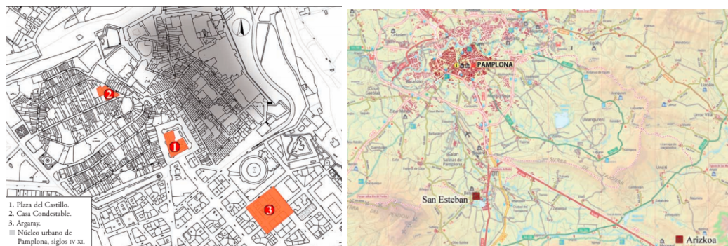
3 eta 4. irudiak: Atal honetan aztertutako aztarnategien kokapen-mapak (Faro, García-Barberena eta Unzu, 2007-8:239 eta 249)

Iruñea inguruan antzeko tipologia aurkezten dizkiguten beste zenbait nekropoli ere aurkitu izan dira, batzuk, Gazteluko Plazaren antzera, egungo hiriaren mugen barruan, eta beste batzuk honetatik kilometro gutxira. Horrela, atal honen ikerketa xede izango dira Iruñean aurkitzen ditugun Argaray eta Kondestablearen Etxea, eta hiritik 10 eta 18 kilometrora aurkitzen diren San Estebaneko eta Arizkoako nekropoli kristauak.