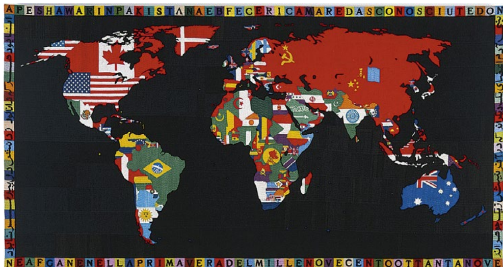
Fig. 1. Mapa del mundo , Alighiero e Boetti, 1989. 117,5 x 227,7 x 5,1 cm.

Con ese cambio de lealtades entre proyecciones rivales, Boetti puso de manifiesto que unas informaciones de apariencia objetiva, ejemplificadas en omnipresentes esquemas científicos y objetos cotidianos (como el mapa escolar), contienen una carga ideológica y no constituyen descripciones neutrales. (Boetti 2011)