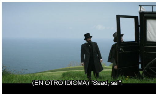
IMAGEN 4. Escena Reunión de gigantes, intervención en árabe en la versión ES_SPS