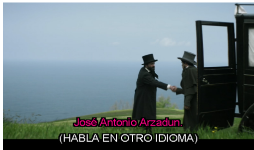
IMAGEN 3. Escena Reunión de gigantes, intervención en inglés en la versión ES_SPS

Esta lengua se incluye en una escena en la que se emplean el inglés y el árabe. Se pronuncia únicamente una palabra en cada lengua, cuando los personajes principales acuden a la reunión de los gigantes en el Reino Unido y el acompañante del gigante árabe saluda a Arzadun. En este caso, el saludo de Arzadun en inglés ( Hello ) no se traduce en ninguna versión, pero sí la petición del acompañante árabe al gigante para que salga del carruaje. Aunque ambas lenguas desempeñen la función de mostrar realismo en el original, el saludo en inglés le es más conocido al espectador no anglófono que el fragmento en árabe. El audio original no cuenta con traducción para ninguna de las dos intervenciones, a diferencia de las versiones meta que sí ofrecen traducción para el árabe, por lo que se amplía la información que reciben los espectadores. Al igual que en el caso del portugués, en ES_SPS se señala el empleo de otra lengua, en este caso, sin especificar cuál es. Las Imágenes 3 y 4 muestran que se usa la misma etiqueta para ambas lenguas sin concretar cuándo se habla en inglés ( Imagen 3 ) y cuándo en árabe ( Imagen 4 ), lo que puede sugerir un efecto similar al del audio original.