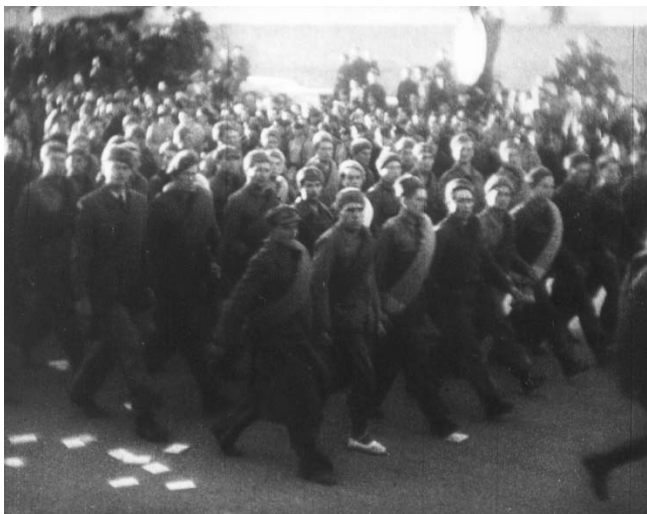
Fotograma del documental España : brigadistas desfilando por la Avenida 14 de Abril, de Barcelona, el 28 de octubre de 1938.

Roman Karmen recordaba, en su propio documental Grenada, Grenada, Grenada moia (1967), su llegada a España así: «Hace 30 años, el operador Boris Makasseiev y yo mismo atravesamos la frontera española. Hace mucho de esto, mucho tiempo. Todo lo que vi, todo cuanto viví en aquel país ha quedado para siempre en mi memoria» 28 . Ambos se interesaron no sólo por lo que ocurría en el frente, por los soldados que combatían, sino también por los problemas de la retaguardia: la escasez de alimentos, el