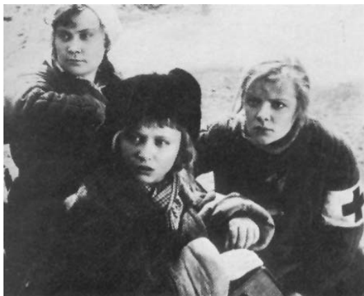
Las tres amigas.

Leo Arnstam debutó como realizador de largometrajes con Las tres amigas –Podrugi– (1936) que muestra el papel de la mujer antes y durante la Revolución rusa. Es un filme más psicológico que de acción, ya que la gesta revolucionaria es un simple telón de fondo del tormento interior de las protagonistas: Zoja, Natasa y Asja. Siendo unas niñas pobres conocen a dos revolucionarios clandestinos, Silye y Andrei. Unos años más tarde, ellos y ellas combaten en varios frentes durante la Guerra