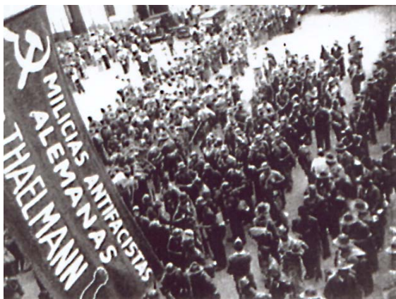
Fotograma del noticiario número 3 K sobitiyam v Ispanii : voluntarios del Batallón Thaelmann en el patio del Cuartel Carlos Marx de Barcelona.