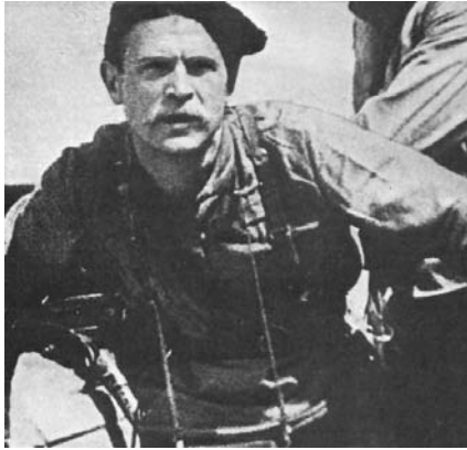
Tchapaïeff, el guerrillero rojo.

por la Sección de Propaganda Cultural del Ministerio de Instrucción Pública y Bellas Artes. Asistieron al acto, que tuvo un rotundo éxito de público, el presidente de la República Manuel Azaña, los ministros sin cartera, José Giral y Manuel Irujo y el titular de la entidad organizadora, Jesús Hernández. El crítico del ABC , en la edición madrileña del 20 de octubre, consideraba un gran acierto su estreno en esos momentos porque comparaba la situación de Petrogrado en la Guerra Civil rusa con la de Madrid en 1936. El corresponsal soviético Mijail Koltsov recordaba el estreno de esta cinta en Madrid de esta forma: «La luz brillante, alumbra todo el local. Gritos de ¡Viva Rusia! se mezclan con la majestuosa melodía de La Internacional y del himno republicano» 49 .