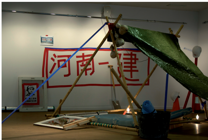
Jornada de bandera (Pekín, 2010)

Materiales: Madera, caña de bambú, cartón, pintura, objetos, fotografía. Dim.variables.