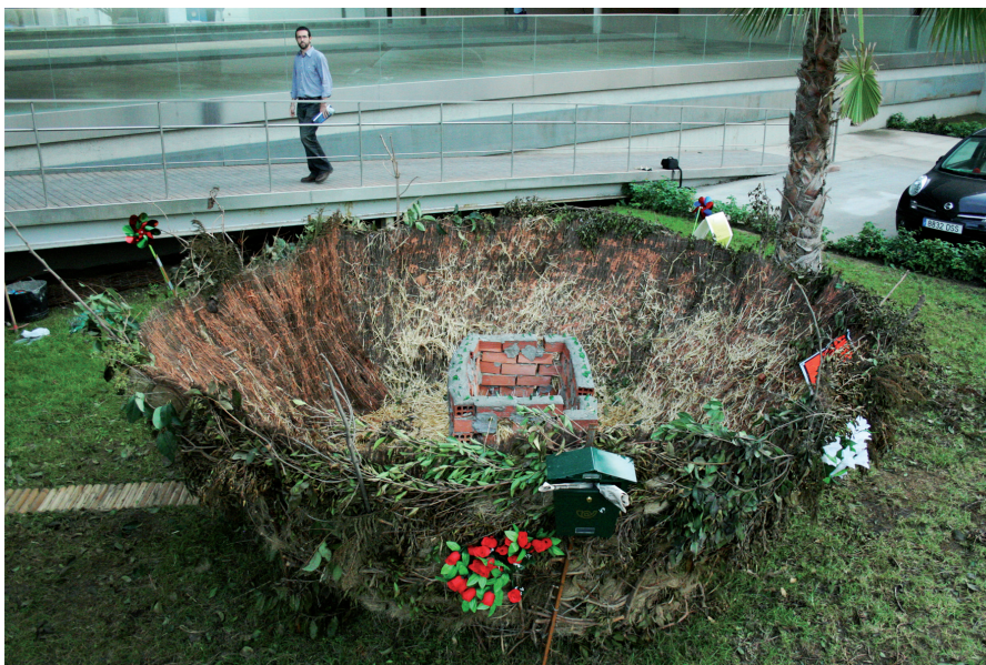
Un cobijo para el hombre pájaro (Málaga, 2008)

Materiales: Ramas, paja, barro y cristal. Dimensiones: 450x165 cm.