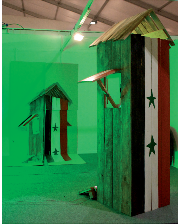
Desde la garita sólo en verde flúor (Siria, 2010)

APROXIMACIÓN FENOMENOLÓGICA AL CONCEPTO DE REFUGIO TEMPORAL. ANCRONISMOS DE UNA CONSTRUCCIÓN INESTABLE