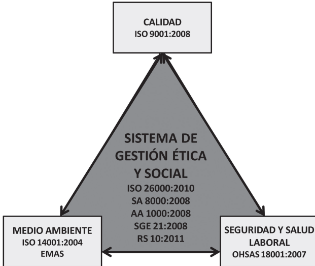
Figura 2. El sistema de gestión ética y social como base para la integración de los sistemas de gestión de la organización